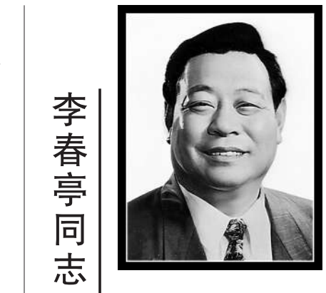
新华社济南8月28日电

谷善庆是中国共产党第十四次全国代表大会代表、第十四届中央委员会委员,第九届全国人民代表大会常务委员、财经委员会委员。他1988年被授予少将军衔,1990年晋升为中将军衔,1994年晋升为上将军衔,曾荣获解放奖章和中国人民解放军胜利功勋荣誉章。