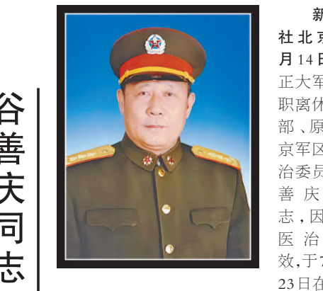
新华社北京8月14日电

一版责编:许诺 张帅桢 赵政 二版责编:蒋薇婕 郭雪岩 田先进 三版责编:于景浩 戴楷然 李安琪 四版责编:袁振喜 张佳莹 翟钦奇