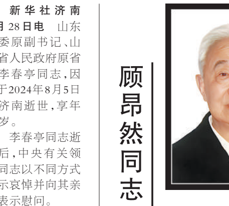
新华社北京9月6日电

李春亭是中共第十四届中央候补委员、第十五届中央委员,第九届全国人大农业与农村委员会副主任委员,第十届全国人大常委会委员、农业与农村委员会副主任委员。