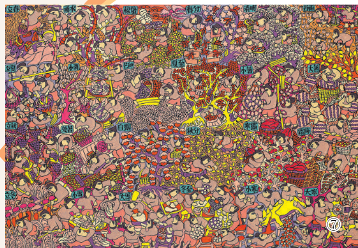
图⑥:农民画《俏金秋》。 赵庆玲绘,刘燕提供 图⑦:农民画《二十四节气宁波篇》。 余海君绘,刘燕提供

“春山淡冶而如笑,夏山苍翠而如滴,秋山明净而如妆,冬山惨淡而如睡”。这是北宋大画家郭熙对画山技法的“四如”之说,流传颇广。四季循环往复,各有特色,绘画中的山水也季节分明,美不胜收。