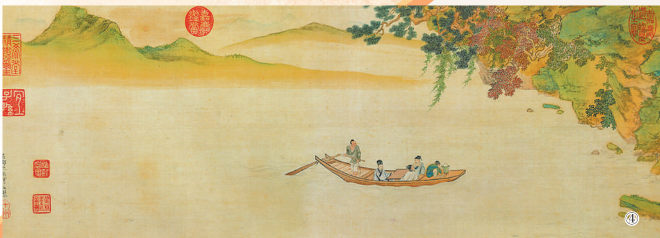
图①:马和之《月色秋声图》。 图②:刘松年《秋窗读易图》。 图③:萧照《秋山红树图》。 图④:仇英《赤壁图卷》局部。 图⑤:赵孟頫书法作品《秋声赋》局部。

上文仅列出辽博的部分秋景画作,在琳琅满目的古代绘画中,描绘秋景的画作极多,尤其到了元明清之际,大多数画家笔下都有秋景的呈现。在这些古画里,我们能够看到不同的秋意,有的冷僻萧瑟,有的生机勃勃,还有的带着浓厚的人情味,不论这些秋天是何种景象,它们都是属于秋季的一丝古韵。