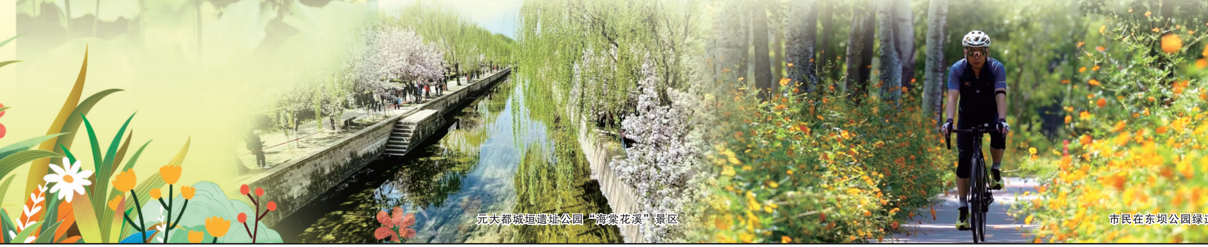
元大都城垣遗址公园“海棠花溪”景区