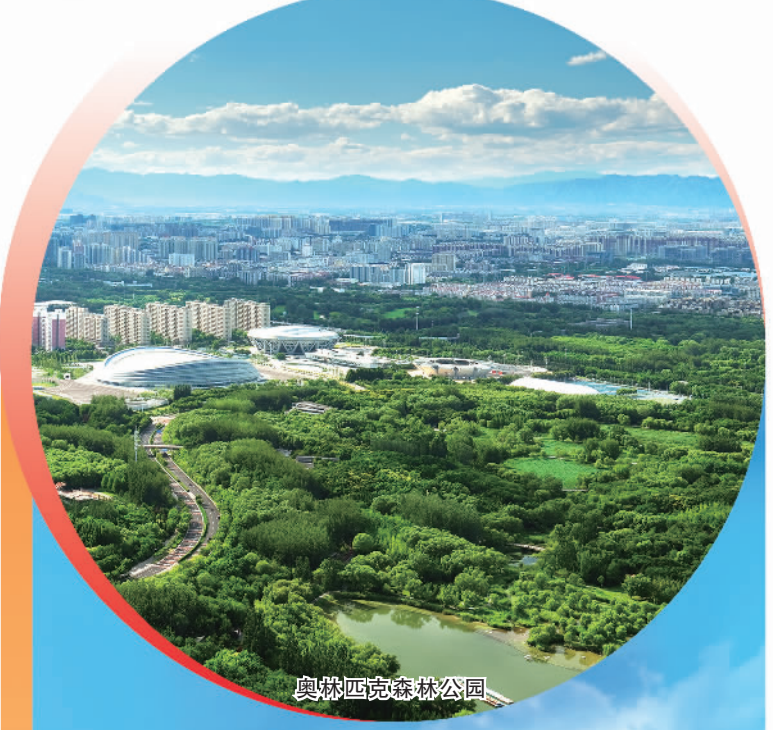
奥林匹克森林公园