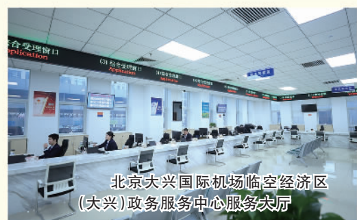
北京大兴国际机场临空经济区(大兴)政务服务中心服务大厅

5年来,京津冀协同发展体制机制改革创新在临空区大兴片区落实落细、开花结果。京冀两地不断创新优化审批流程,将300余项省(市)级、市(区)级行政审批权力下放至临空区大兴片区和廊坊片区,提供“一站式”政务服务。在临空区大兴片区开展企业投资项目“区域评估+标准地+告知承诺+综合服务”改革,事项办结时限压缩50%以上。同时,临空区大兴片区实现赋权事项与北京城市副中心、河北雄安新区的跨省市、跨区域业务通办,同步推动京津冀203项“同事同标”政务服务事项及165项资质互认事项在中国(北京)自由