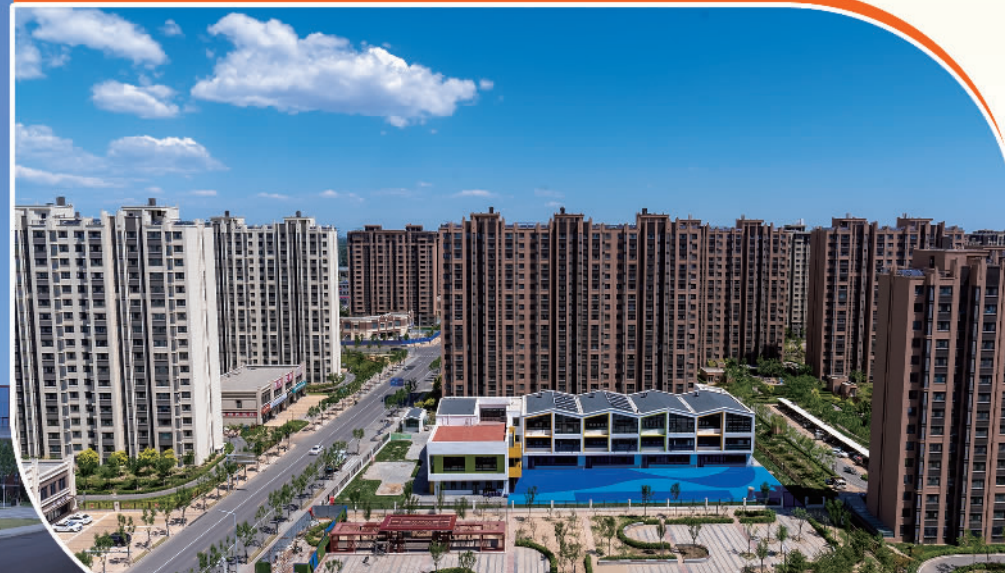
大兴机场安置房(榆堡组团)