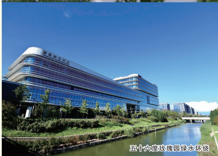
五十六度玫瑰园绿水环境