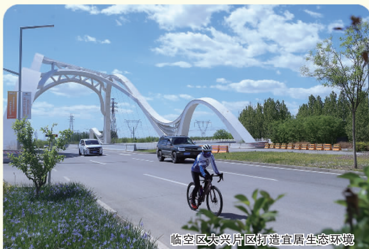
临空区大兴片区打造宜居生态环境