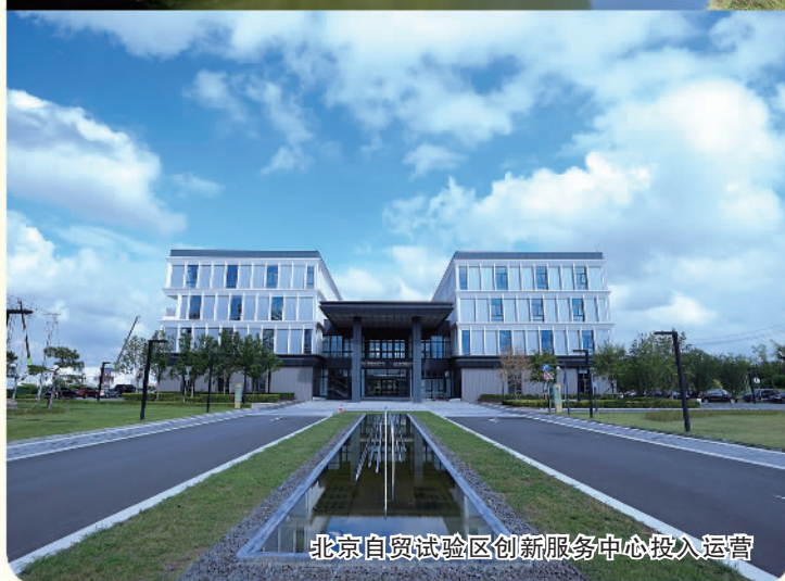
北京自贸试验区创新服务中心投入运营