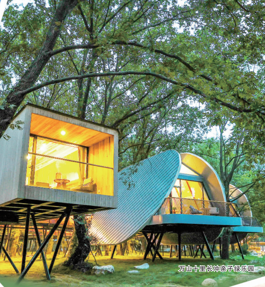
万山十里长冲亲子乐园