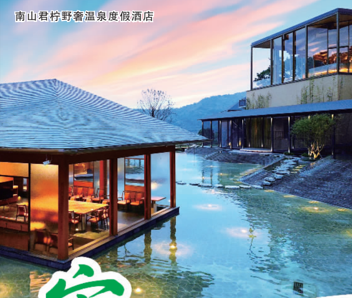
南山君村野奢温泉度假酒店