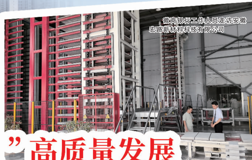
徽商银行工作人员走访安徽宏路新材料科技有限公司