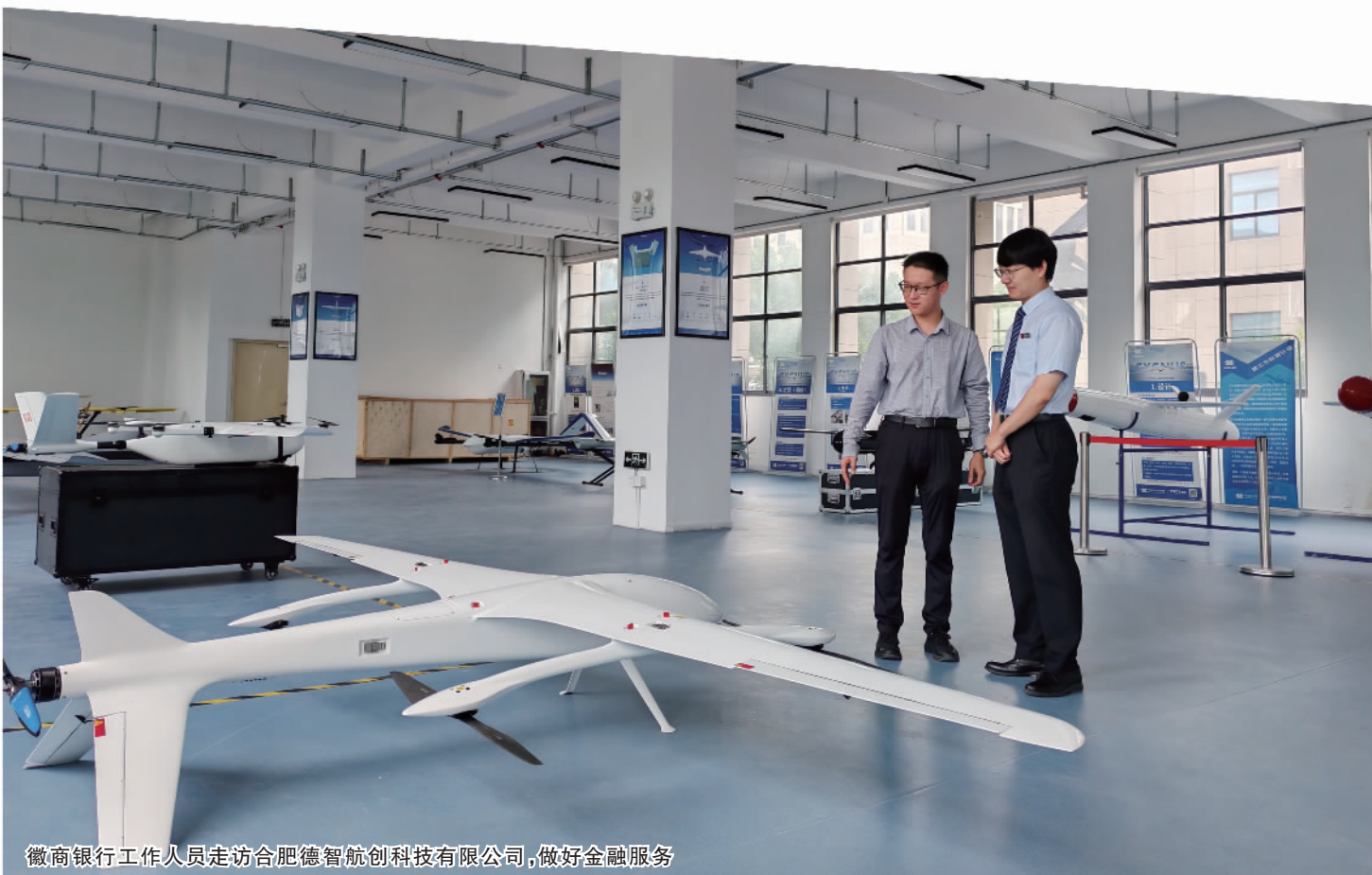
徽商银行工作人员走访合肥德智航创科技有限公司，做好金融服务