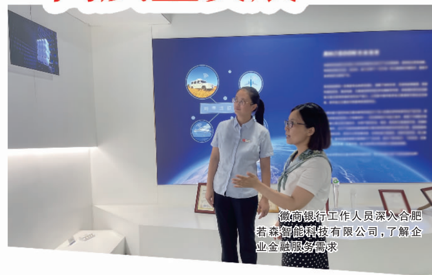
徽商银行工作人员深入合肥若森智能科技有限公司，了解企业金融服务需求