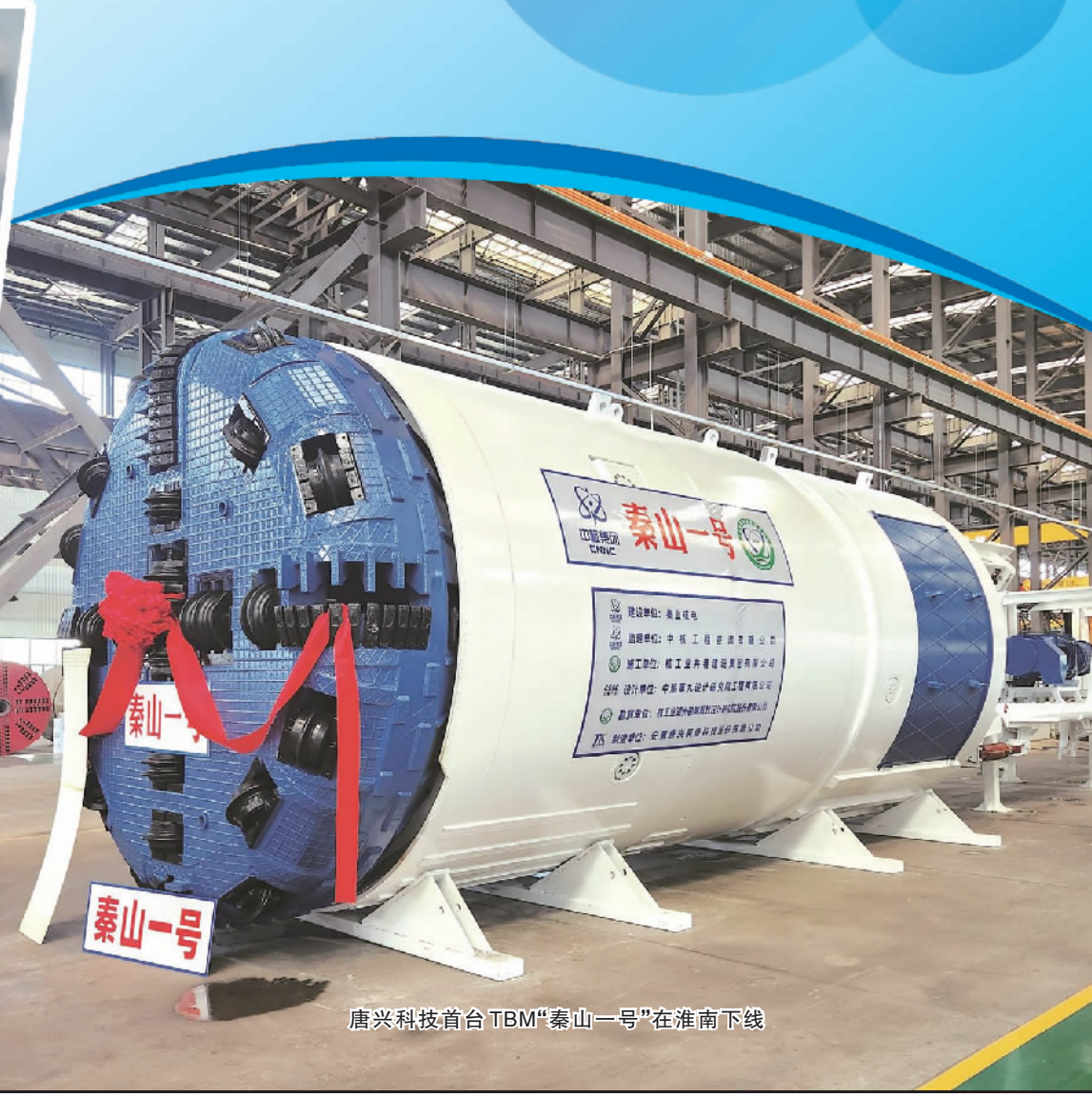
唐兴科技首台TBM“泰山一号”在淮南下线