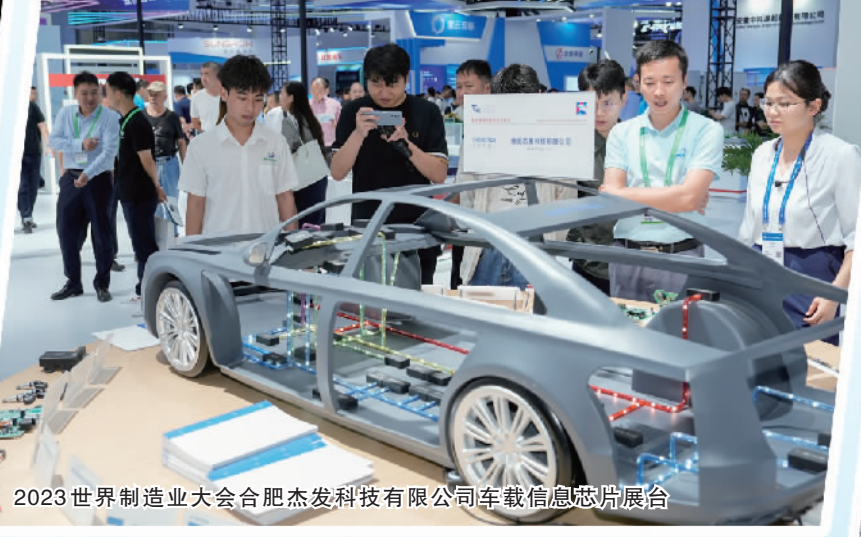
2023世界制造业大会合肥杰发科技有限公司车载信息娱乐屏展台