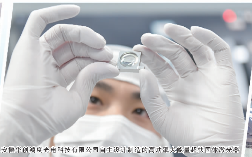
安徽华创鸿度光电技术有限公司自主设计制造的高功率高能超快固体激光器