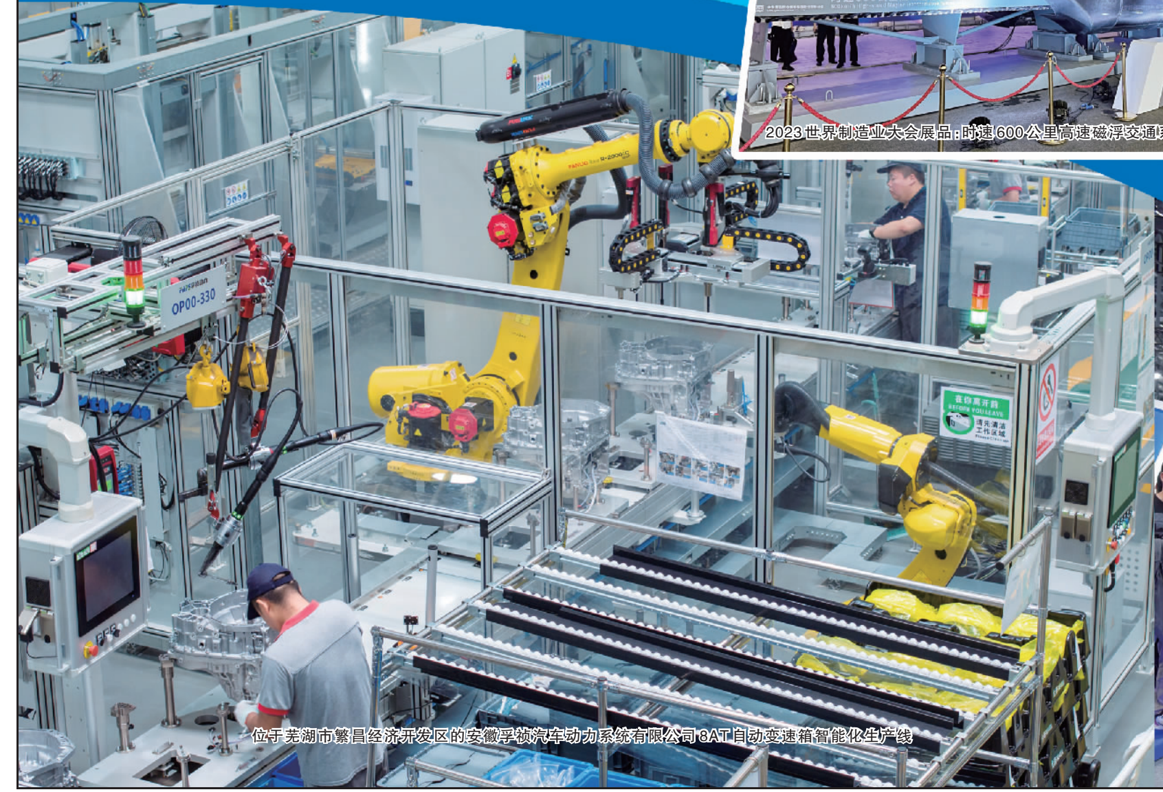
位于芜湖市繁昌经济开发区的奇瑞汽车动力总成有限公司QAT全自动变速箱智能化生产线