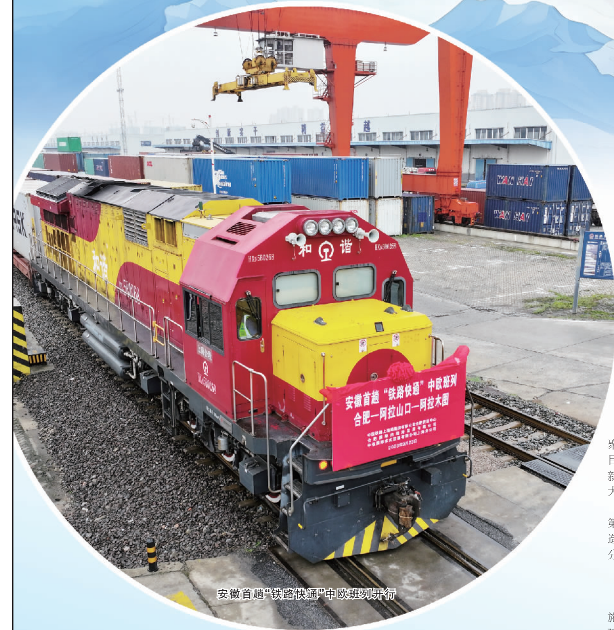
安徽首趟“铁路快通”中欧班列开行

近年来，安徽省锚定打造具有重要影响力的科技创新策源地、新兴产业聚集地，改革开放新高地和经济社会发展全面绿色转型区的“三地一区”发展目标，深入贯彻落实全国新型工业化推进大会部署，牢牢把握高质量发展和新型工业化，深入实施制造强省战略，推动实现从传统农业大省到新兴工业大省、制造业大省的历史性跨越。