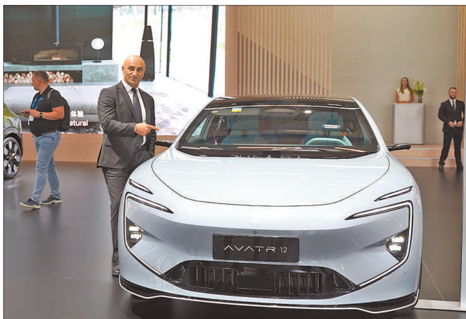
右图:一名观众参观中国品牌电动汽车。