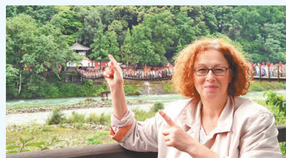
卡米拉在四川都江堰。