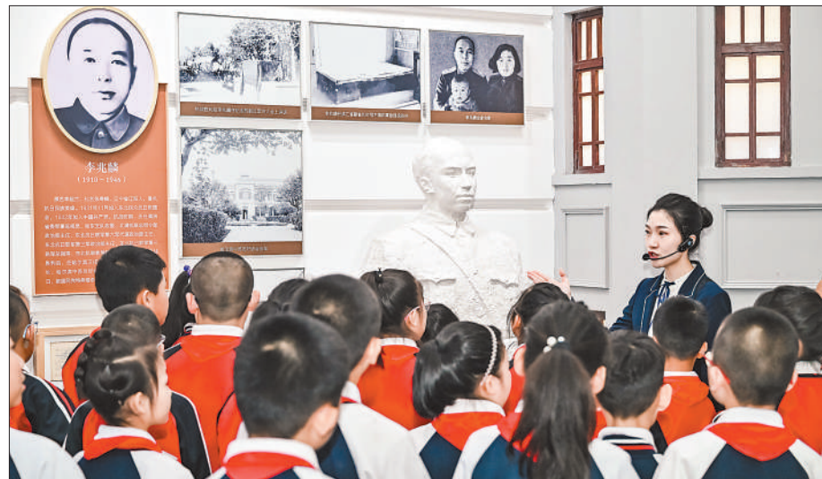
左图：9月18日，共青团黑龙江省委在东北烈士纪念馆举办黑龙江青少年勿忘九一八爱国主义教育。图为活动现场，讲解员在进行讲解。方圆 方言 摄影报道