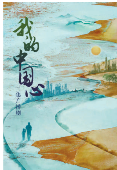
图为广播剧《我的中国心》海报。

在香港回归祖国27周年之际,广播剧《我的中国心》围绕著名爱国人士、香港知名实业家霍英东的人生经历,以纪实手法刻画他把个人事业融入时代、国家与民族命运的历程。作品聚焦人物在重要关头的主动选择,在90分钟的篇幅内,精心选取霍英东的三个人生片段:抗美援朝时期冒着生命危险为祖国运送物资,改革开放初期力排众议到内地投资,香港回归前后参与和推动“一国两制”在香港的实践。主人公自强不息、爱国爱港的赤子人生,映射着时代的洪流所向,打动听众的同时也引发听众思索。在艺术手法上,作品调动声音传播艺术等多种手段,不仅用声音讲故事,还融入岭南文化特色和香港地域特点,努力用声音烘托不同氛围,以丰富听众的感官体验。