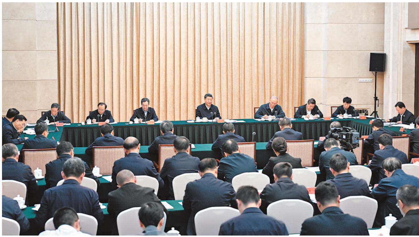
9月12日下午,中共中央总书记、国家主席、中央军委主席习近平在甘肃省兰州市主持召开全面推动黄河流域生态保护和高质量发展座谈会并发表重要讲话。