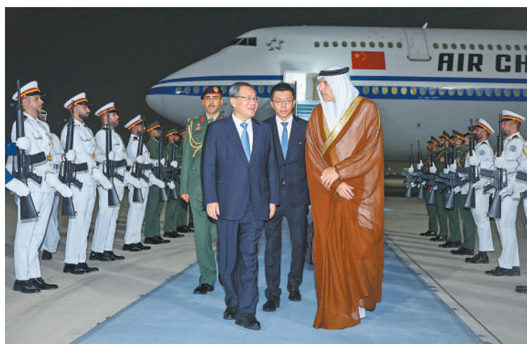
应阿联酋副总统兼总理穆罕默德邀请，国务院总理李强9月11日晚乘包机抵达阿布扎比扎耶德国际机场，开始对阿联酋进行正式访问。阿联酋总统中国事务特使哈勒敦和中国驻阿联酋大使张益明等到机场迎接。

本报阿布扎比9月11日电（记者王迪、张志文）应阿联酋副总统兼总理穆罕默德邀请，国务院总理李强9月11日晚