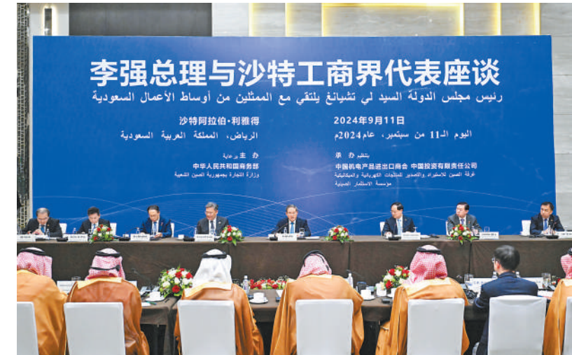
当地时间9月11日上午，国务院总理李强在利雅得同沙特工商界代表座谈交流。

本报利雅得9月11日电（记者王迪）当地时间9月11日上午，国务院总理李强在利雅得同沙特工商界代表座谈交流。沙特投资大臣法利赫、商务大臣卡斯比以及沙特公共投资基金、沙特国家石油公司、沙特基础工业公司、沙特国际电力和水务公司、阿吉兰兄弟控股集团等企业负责人和中国一海合会共同投资联合会代表出席。