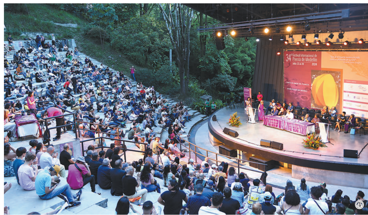
图①：费尔南多·伦德诗歌集《光芒四射的问题》。 图②：第三十四届麦德林国际诗歌节海报。 图③：费尔南多·伦德诗歌集《理想国的歌声》，曹译译。 图④：第三十四届麦德林国际诗歌节开幕式现场。

本版责编：王佳可 庄雪雅 陈照芮 电子信箱：rmbgjk@peopledaily.cn 版式设计：蔡华伟