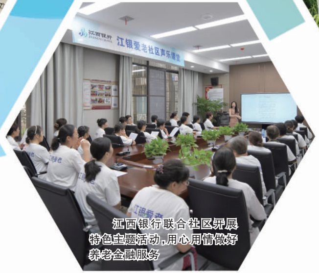
江西银行联合社区开展特色主题活动,用心用情做好养老金融服务