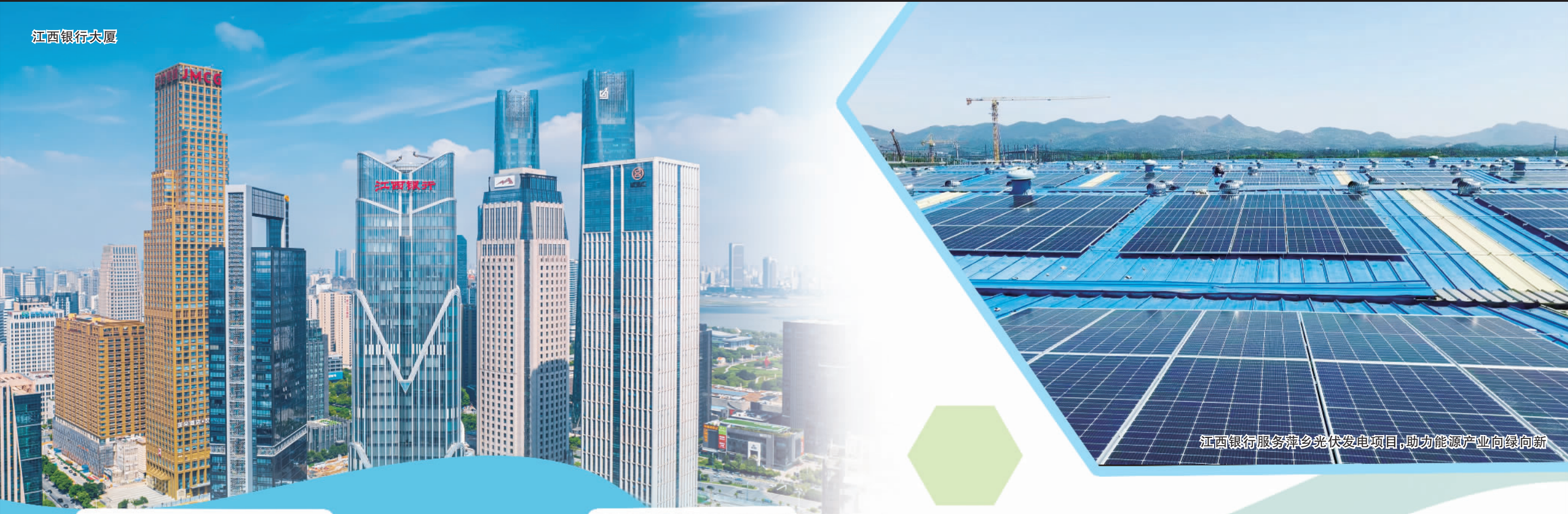
江西银行服务萍乡光伏发电项目,助力能源产业向绿向新