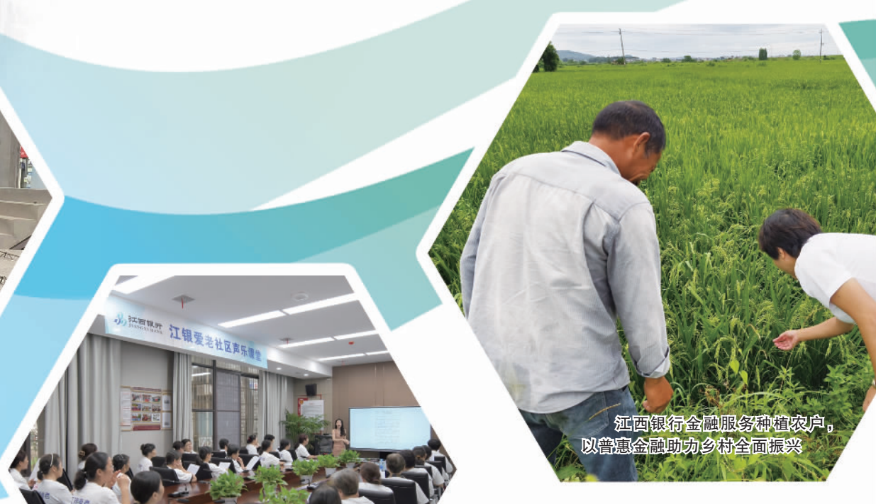
江西银行金融服务种植农户,以普惠金融助力乡村全面振兴