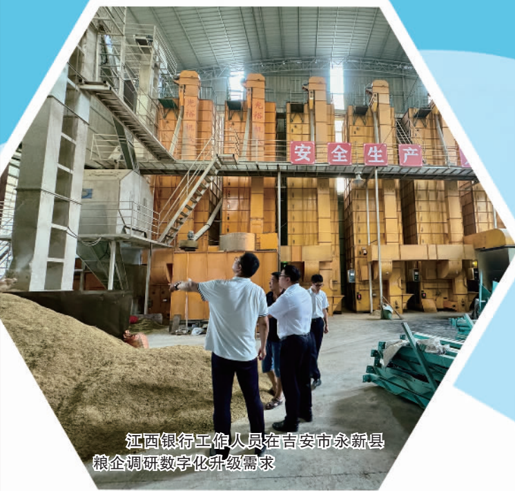
江西银行工作人员在吉安市永新县粮企调研数字化升级需求