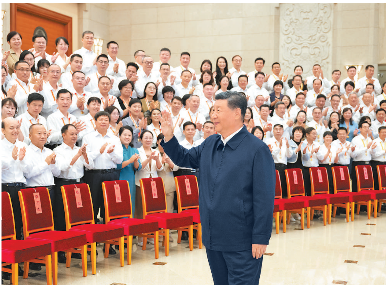
九月九日,党和国家领导人习近平、李强、蔡奇、丁薛祥等在北京接见参加庆祝第四十个教师节暨全国教育系统先进集体和先进个人表彰活动代表。

本报北京9月10日电(记者赵成)全国教育大会9日至10日在北京召开。中共中央总书记、国家主席、中央军委主席习近平出席大会并发表重要讲话。他强调,建成教育强国是近代以来中华民族梦寐以求的美好愿望,是实现以中国式现代化全面推进强国建设、民族复兴伟业的先导任务、坚实基础、战略支撑,必须朝着既定目标扎实迈进。