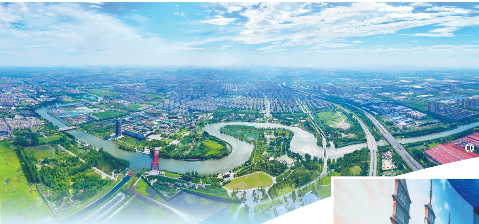
图①：江苏扬州市大运河国家文化公园风光。