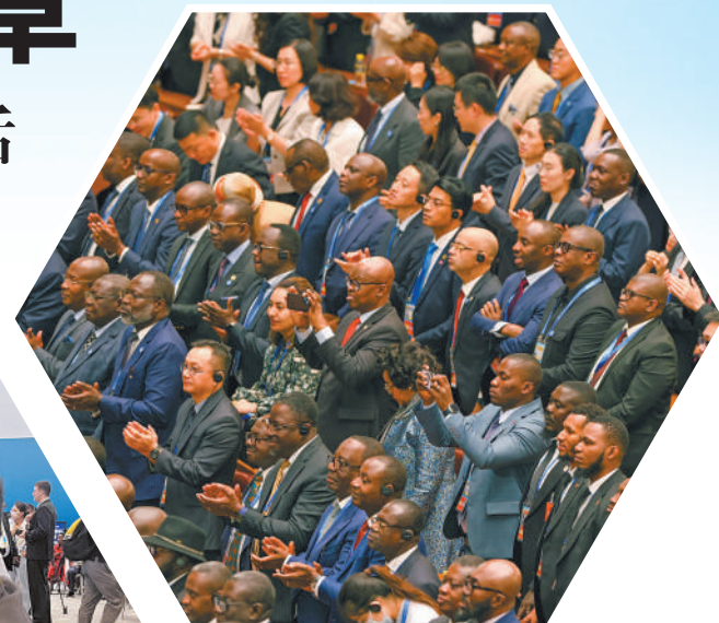
▲9月5日，2024年中非合作论坛北京峰会开幕式现场，中外嘉宾起立鼓掌。 ▲非洲国家媒体记者在新闻中心观看开幕式并做记录。