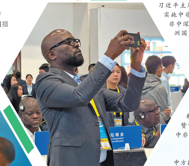
▲非洲国家媒体记者在新闻中心拍摄开幕式转播画面。 ▲非洲国家媒体记者在新闻中心交流。