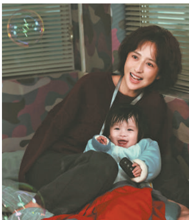
人)剧照。 电影《假如,我是这世上最爱你的人》剧照。

最近上映的电影《假如,我是这世上最爱你的人》讲述了一个从被抛弃到不放弃再到为了爱而“放弃”的感人故事。影片中呈现的一对残障姐弟的日常工作和生活,用平和的视角,展现残障人士的坚韧、乐观、善良和爱心,给予观众新的视角去理解生活。