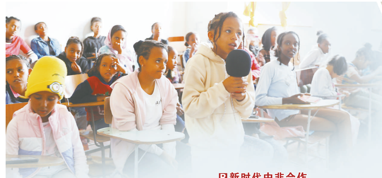
▲厄立特里亚高等教育与研究院孔子学院于2013年成立,是该国唯一一所孔子学院。多年来,这里培养的大量中文学子已成为两国民心相通的使者和文化交流的桥梁。图为孔子学院学生学唱中文歌曲《同一首歌》。