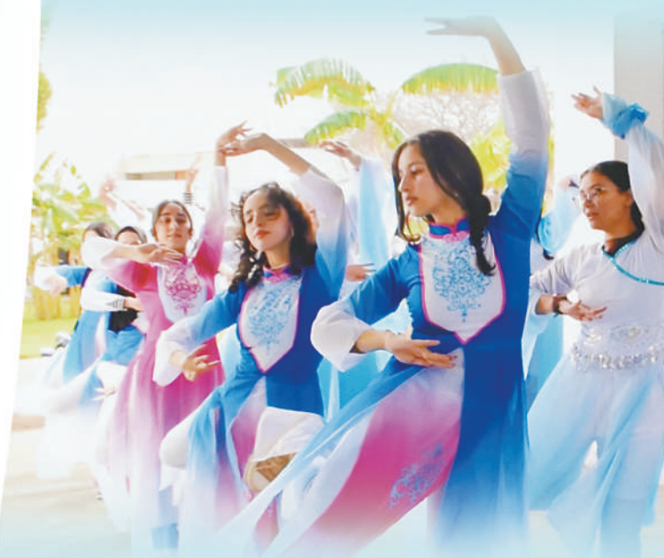
▲摩洛哥哈桑二世大学孔子学院位于该国最大城市卡萨布兰卡。院内经常开展中国语言文化和节日庆祝活动。图为孔子学院学生在排练中国舞。