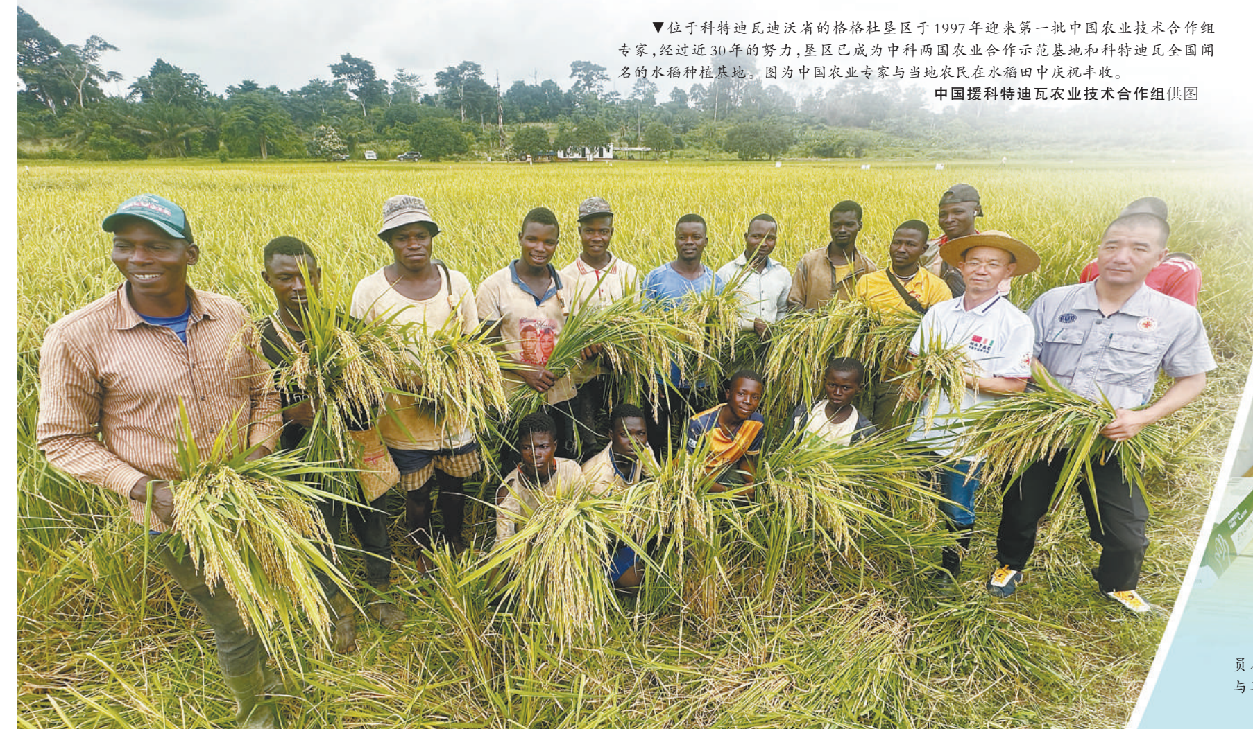
▼位于科特迪瓦迪沃省的格格杜垦区于1997年迎来第一批中国农业技术合作组专家,经过近30年的努力,垦区已成为中非两国农业合作示范基地和科特迪瓦全国闻名的水稻种植地。图为中国农业专家与当地农民在水稻田中庆祝丰收。