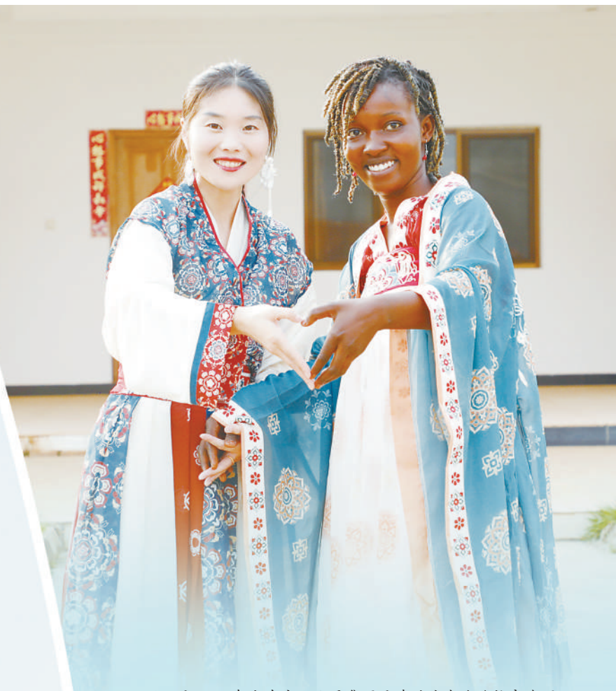
▲2月9日,在由中交一公局集团承建的喀麦隆雅高高速公路项目的中方员工和喀方员工共同庆祝春节。