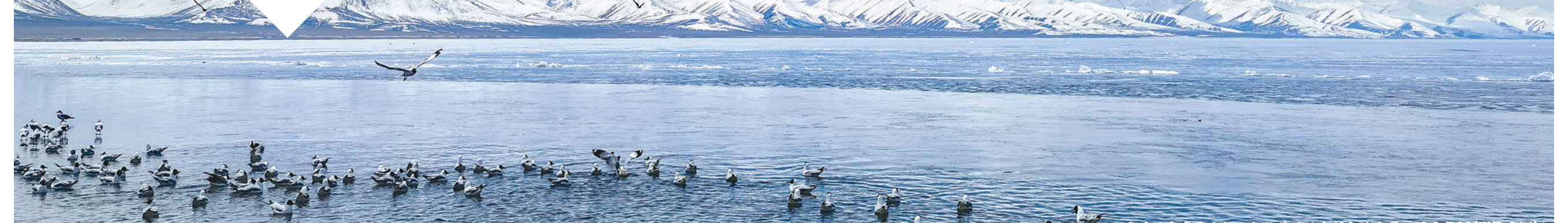
雪域的念青唐古拉山与苍美的纳木错相映成景。

本版策划：纪雅楠 吴燕 本版责编：臧春雷 张伟昊 卢涛 杨颜非 版式设计：蔡华伟