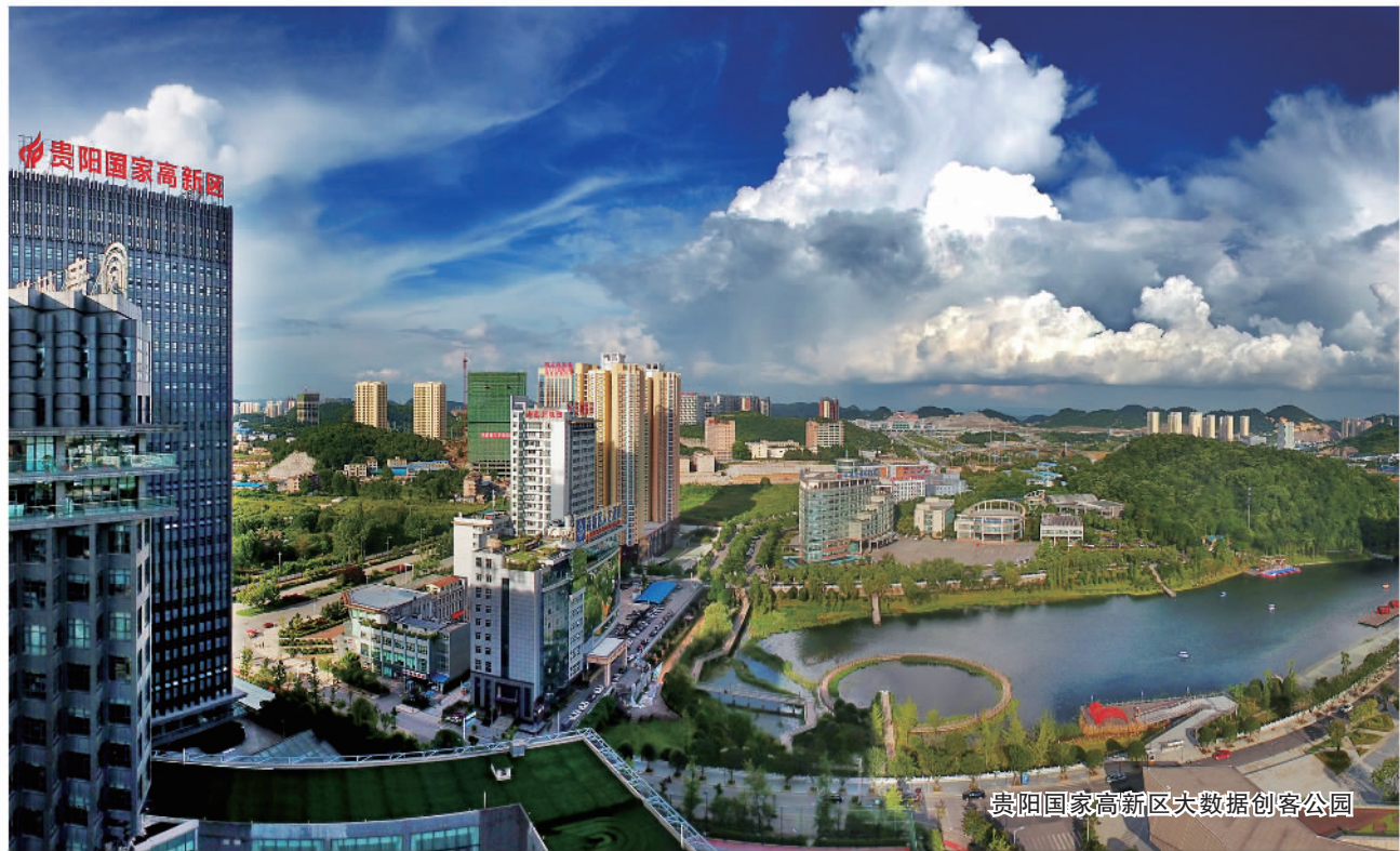
贵阳国家高新区大数据创客公园

贵州是8个国家算力枢纽节点之一以及10个国家数据中心集群之一。近年来,在数字化浪潮的推动下,贵阳贵安实现了算力设施的跨越式增长,数实融合向更广更深迈进,数字产业实力大幅提升,数字经济不断焕发新的生机与活力。2023年,贵阳贵安数字经济增加值占地区生产总值的比重超过52%,数字经济成为高质量发展的新引擎。