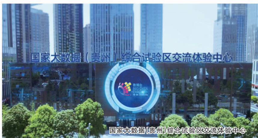
国家大数据(贵州)综合试验区交流体验中心