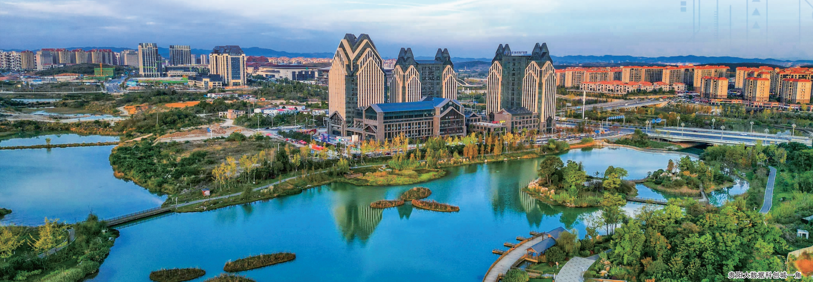
贵阳大数据科创城一角