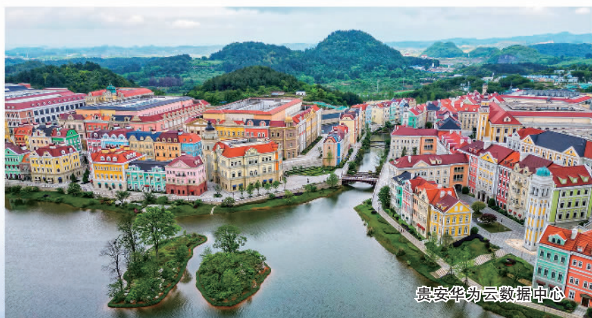
贵安华劬云数据中心