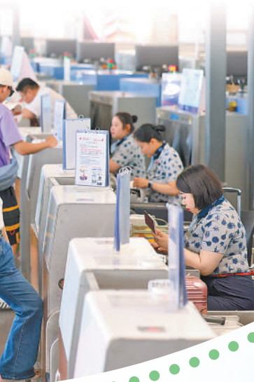
▲近日,旅客在南京禄口国际机场T2航站楼办理乘机手续。

据介绍,首都机场暑运前就全面制定了工作方案。截至8月21日,机场整体靠桥率接近80%,较2019年提升15.69个百分点,95%