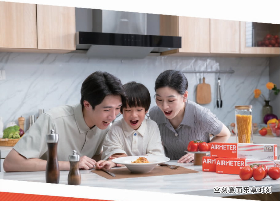
空刻意面乐享时刻