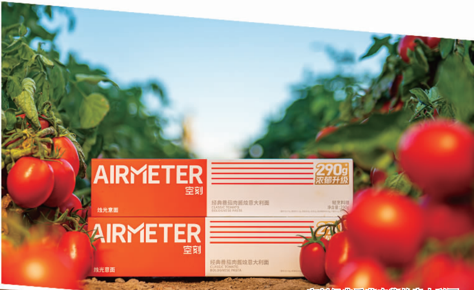
空刻经典番茄肉酱烩意大利面