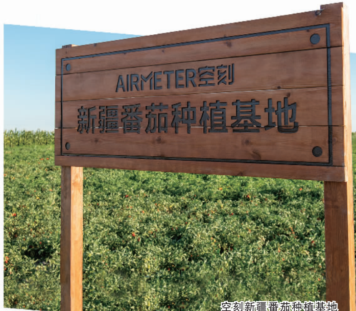
空刻新疆番茄种植基地