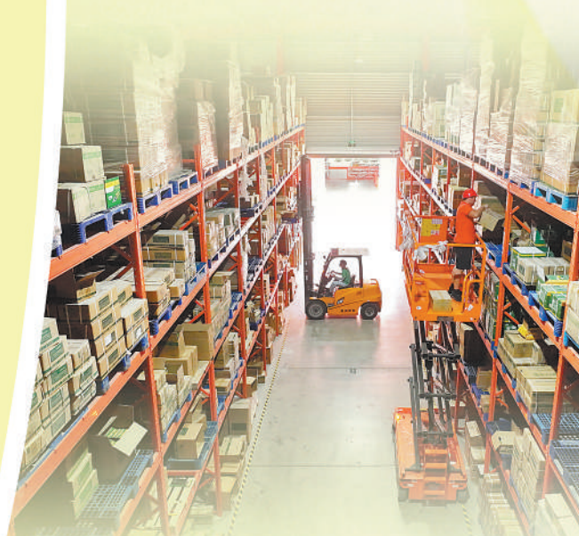
▲虞城县一家五金工量具生产企业的仓库内,工人对产品进行整理分类。

河南省虞城县地处豫东,因优质的工量具制造水平,被誉为钢卷尺之城,是全国科技进步先进县。