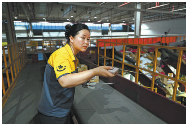
▲虞城县一家快递公司的工作人员在对五金快递件进行遥控分拣。