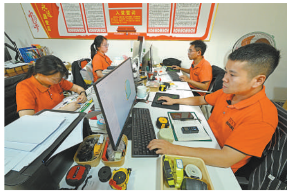
▲虞城县邦特工量具有限公司的设计人员在设计五金产品外观。