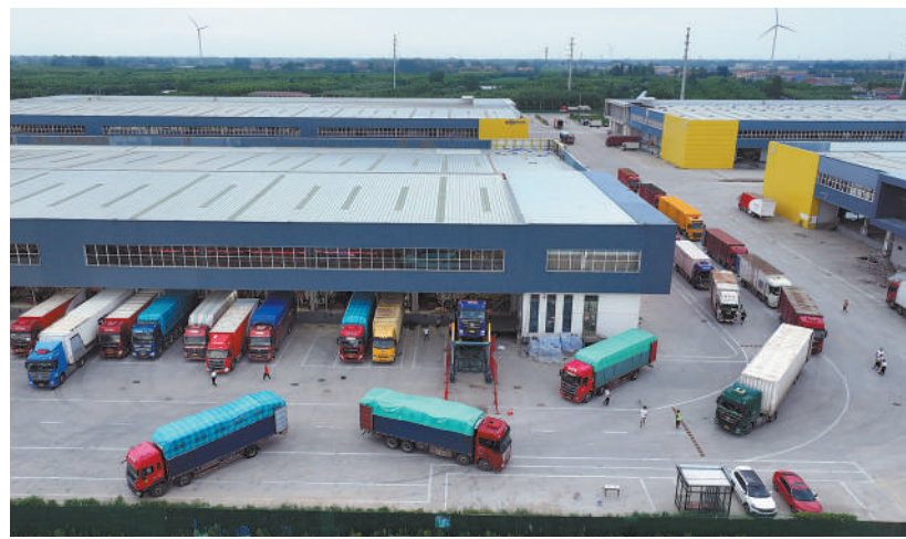
▲虞城县电商物流园,载有五金工量具的货车正在准备发车,五金工量具由此发向全国各地。