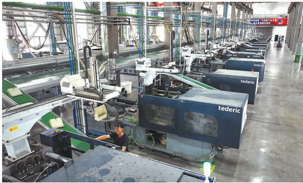
本版责编 袁振喜 杨烁壁 张佳莹 版式设计 沈亦伶