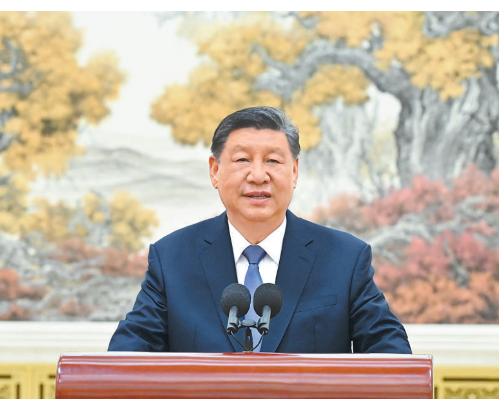
8月20日,党和国家领导人习近平、赵乐际、王沪宁、蔡奇、李希、韩正等在人民大会堂接见第33届夏季奥林匹克运动会中国体育代表团全体成员。这是习近平发表重要讲话。