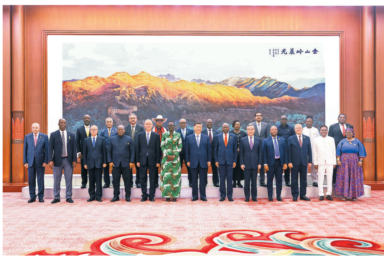
8月20日下午,国家主席习近平在北京人民大会堂集体会见出席全国人大加入各国议会联盟40周年纪念活动暨第六次发展中国家议员研讨班外方议会领导人。

新华社北京8月20日电 (记者马卓言)8月20日下午,国家主席习近平在北京人民大会堂集体会见出席全国人大加入各国议会联盟40周年纪念活动暨第六次发展中国家议员研讨班外方议会领导人。