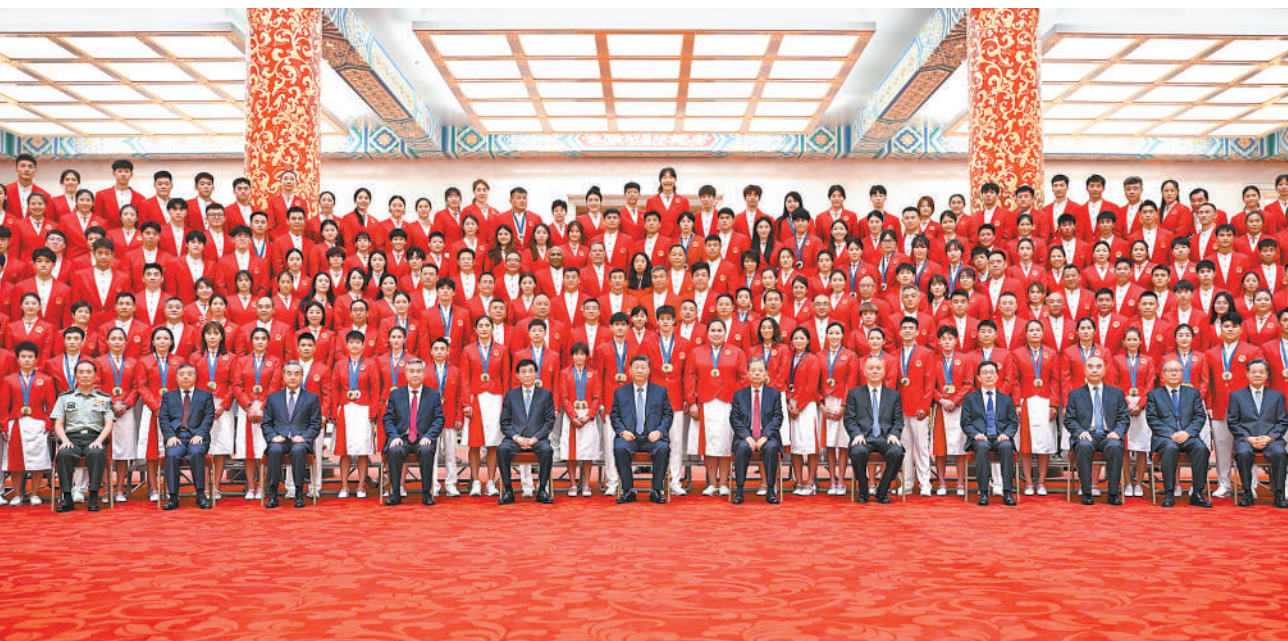
8月20日,党和国家领导人习近平、赵乐际、王沪宁、蔡奇、李希、韩正等在人民大会堂接见第33届夏季奥林匹克运动会中国体育代表团全体成员。

本报北京8月20日电 中共中央总书记、国家主席、中央军委主席习近平20日下午在人民大会堂接见第33届夏季奥林匹克运动会中国体育代表团全体成员。他强调,在巴黎奥运会上,你们团结一心、顽强拼搏,奋勇争先、不负使命,取得我国参加夏季奥运会境外参赛历史最好成绩,实现了比赛成绩和精神文明双丰收,为祖国和人民赢得了荣誉。他代表党中央和国务院欢迎大家凯旋,向大家致以热烈祝贺和诚挚慰问,并向全国体育战线的同志们表示亲切问候。