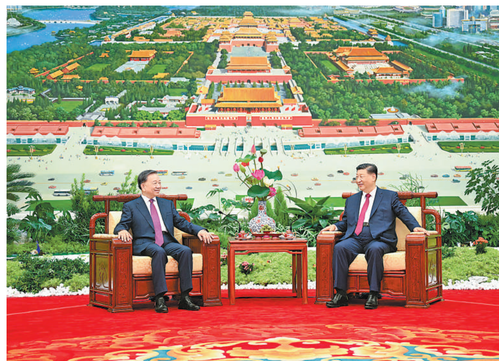
8月19日,中共中央总书记、国家主席习近平在北京人民大会堂同来华进行国事访问的越共中央总书记、国家主席苏林举行会谈。这是习近平同苏林进行小范围茶叙。

习近平指出,面对世界之变、时代之变、历史之变,中越两国保持经济快速发展和社会长期稳定,彰显了社会主义制度的优越性和社会主义事业的生命力。中方将越南作为周边外交优先方向,支持越南坚持党的领导,走符合本国国情的社会主义道路,深入推进革新开放和社会主义现代化事业。在各自国家发展的关键时期,中越要把准命运共同体建设的方向,夯实政治互信更高、安全合作更实、务实合作更深、民意基础更牢、多边协调配合更紧、分歧管控解决更好的“六个更”发展格局。中方愿同越方保持密切战略沟通和高层交往,坚定相互支持,积极探索拓展共建“一带一路”倡议和“两廊一圈”框架对接合作,加快推进铁路、高速公路、口岸基础设施“硬联通”,提升智慧海关“软联通”,携手打造安全、稳定的产业链供应链。以明年庆祝中越建交75周年为契机,共同举办好“中越人文交流年”等一系列活动,巩固两国民意根基。双方要秉持和平共处五项原则等国际关系基本准则,推动平等有序的世界多极化、普惠包容的经济全球化,维护国际公平正义和发展中国家共同利益,推动构建人类命运共同体。