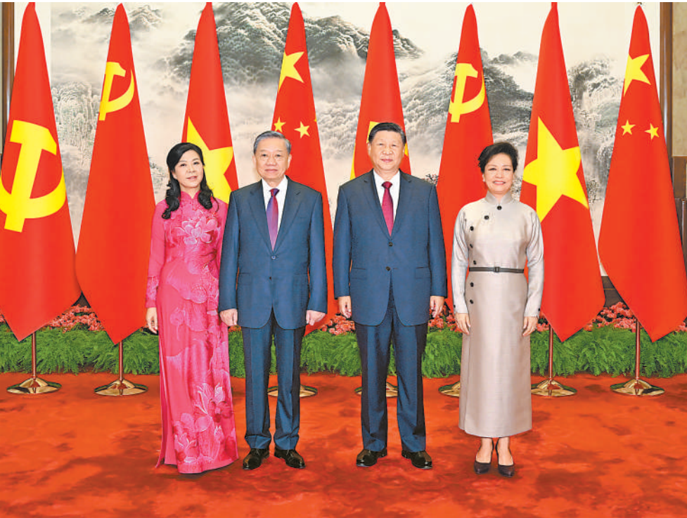
8月19日,中共中央总书记、国家主席习近平在北京人民大会堂同来华进行国事访问的越共中央总书记、国家主席苏林举行会谈。这是会谈前,习近平和夫人彭丽媛同苏林和夫人吴芳瑞合影。