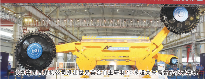
陕煤集团西煤机公司推出世界首台自主研制10米超大采高智能化采煤机