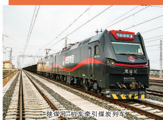
“陕煤号”机车牵引煤炭列车