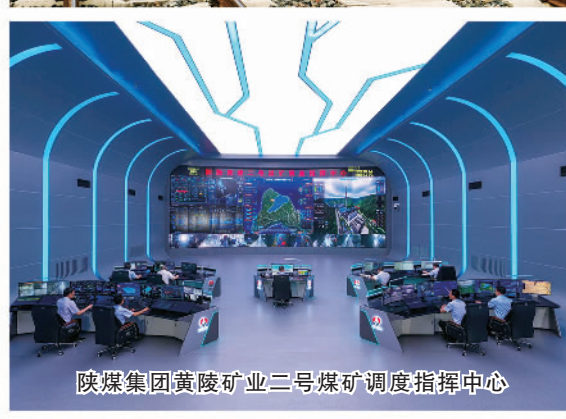
陕煤集团黄陵矿业二号煤矿调度指挥中心