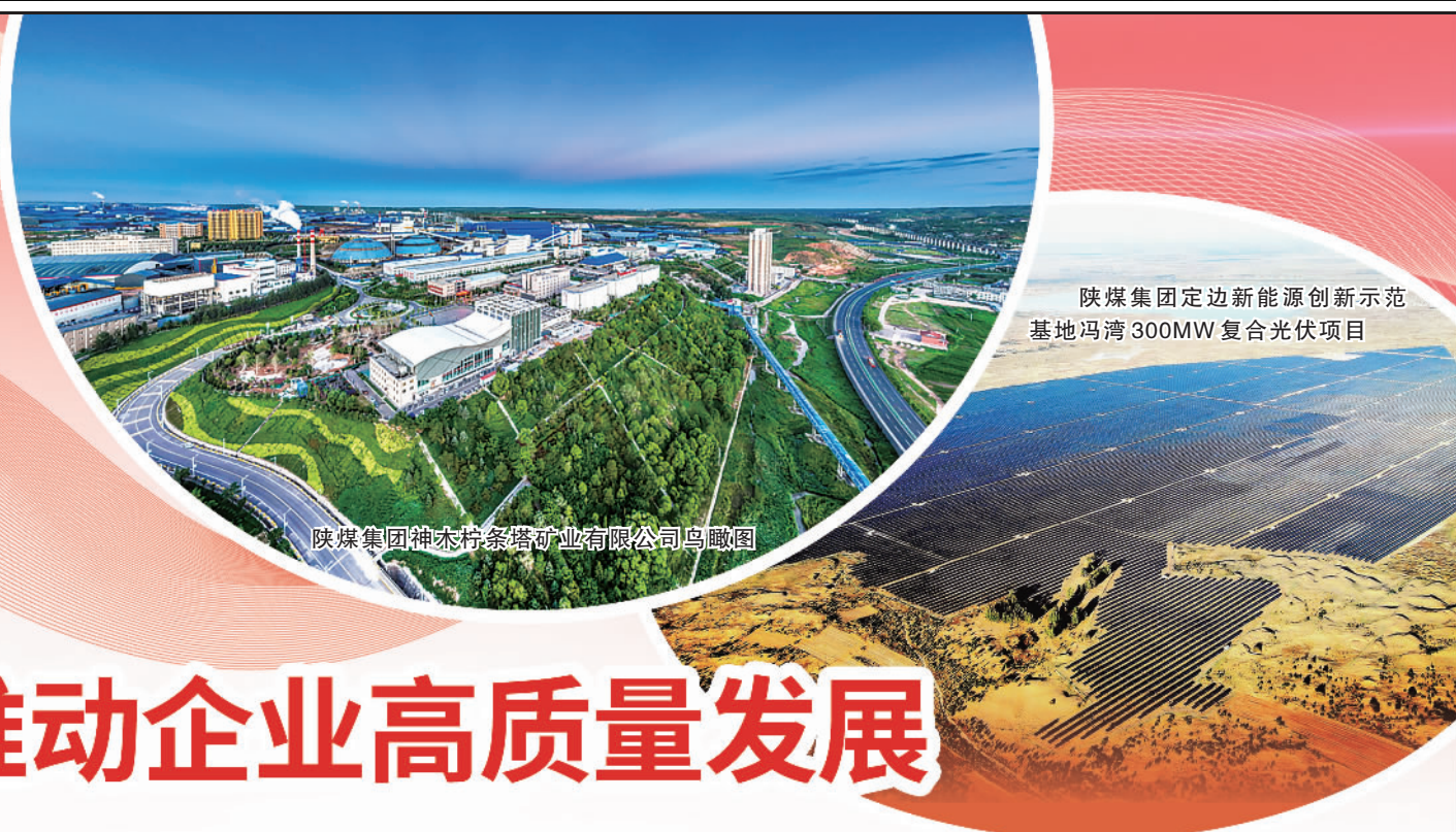
陕煤集团定边新能源创新示范基地冯湾300MW复合光伏项目