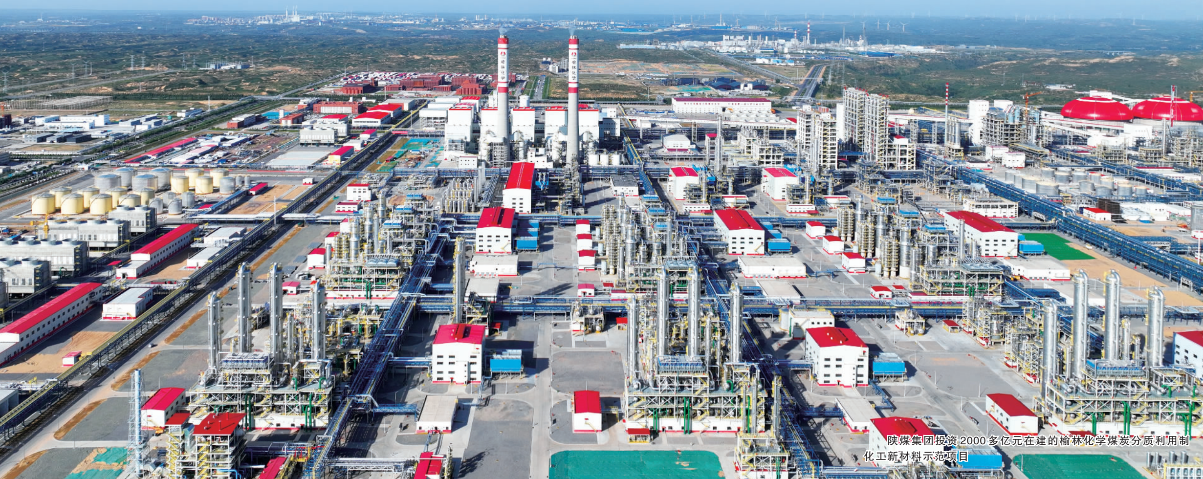
陕煤集团投资2000多亿元在建的榆林化学煤炭分质利用制化工新材料示范项目