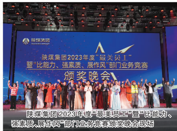
陕煤集团2023年度“最美员工”暨“比能力、强素质、展作风”部门业务竞赛颁奖晚会现场