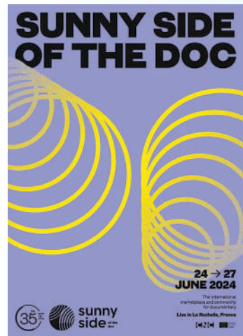
图为第三十五届法国国际阳光纪录片节海报。

阳光、海滩、纪录片……6月24日至27日，第三十五届法国国际阳光纪录片节在法国海滨城市拉罗谢尔举行，一大批题材各异、风格多样的中国纪录片集结亮相，其中中法合作拍摄的纪录片《文明的荣光》《从法国农场到中国餐桌》等作为中法建交60周年暨中法文化旅游年献礼，格外引人注目。