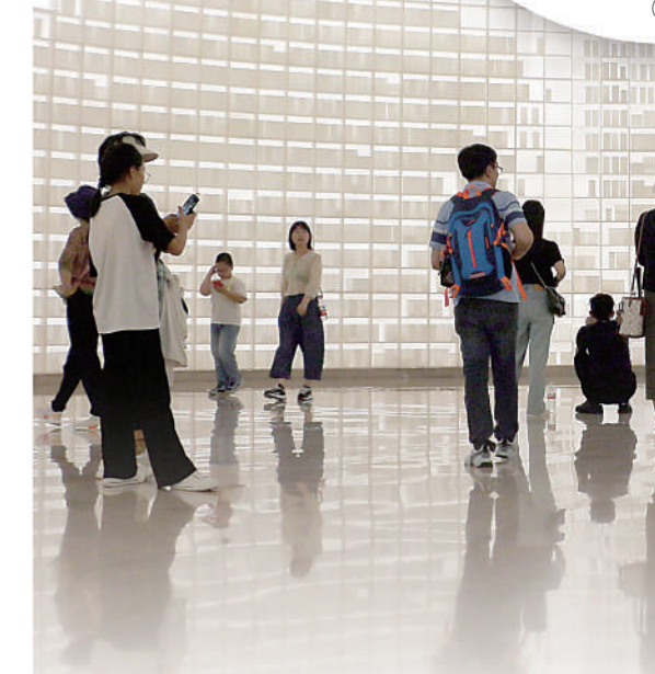
图①:常州博物馆举办的“常博梦华录”活动现场。