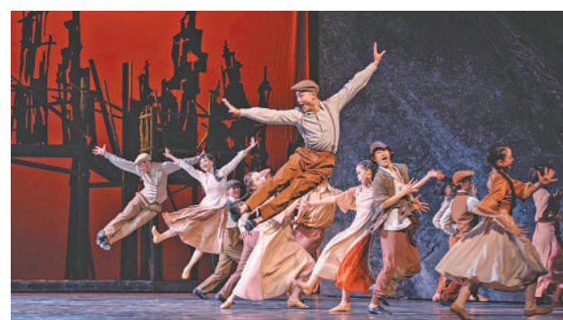
图为舞剧《热血当歌》剧照。

新中国成立75周年之际,中共中央宣传部、文化和旅游部、中国文学艺术界联合会于7月至10月在北京举办“与时代同行 与人民同心”——新时代优秀舞台艺术作品展演活动,从新时代以来全国创作生产或复排的优秀舞台艺术作品中遴选40部进京演出。舞剧《热血当歌》是湖南省唯一一部参演作品。