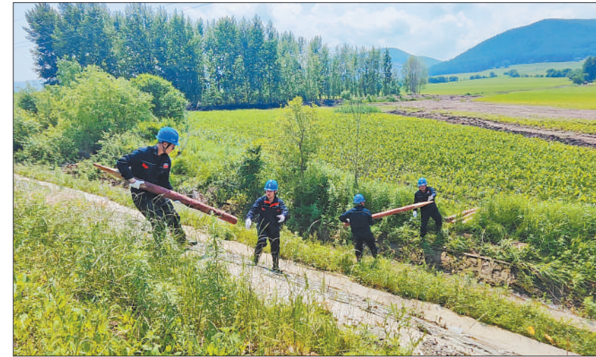
下图：8月13日，中国安能在湖南省资兴市抢修成康村进村受损桥梁。