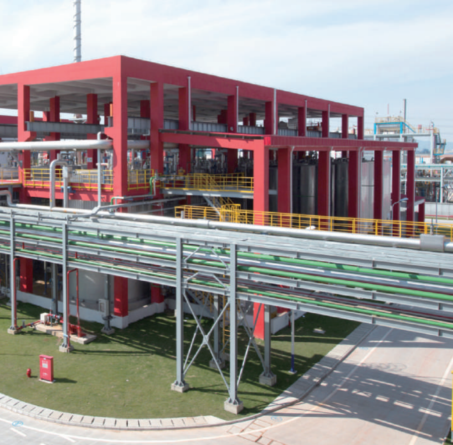
图①:朗盛上海亚太应用开发中心外景。 图②:朗盛在进博会上设立的展台。 图③:朗盛亚太应用开发中心实验室内,工作人员正在操作设备。 图④:朗盛青岛实验室内,研发人员正在工作。 底图:朗盛宁波工厂一景。 制图:张丹峰