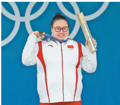
当地时间8月11日，李雯雯在展示举重女子81公斤以上级金牌。

本报巴黎8月11日电 当地时间8月10日晚，中国队双胞胎姐妹王柳懿/王芊懿获得巴黎奥运会花样游泳双人项目金牌，这是中国队首次夺得该项目奥运会金牌，中国队包揽了本届奥运会花样游泳项目两枚金牌。在拳击赛场，中国队选手李倩获得女子75公斤级