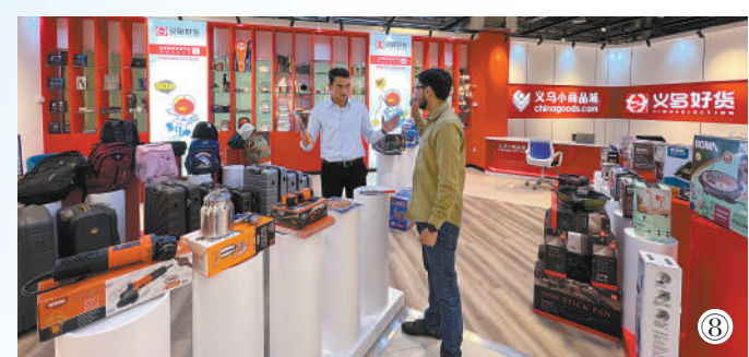
图⑧：“义乌好货”位于迪拜的展厅。

本期统筹 殷新宇 蒋雪婕 本版责编 吕莉 郭雪岩 祁嘉润 梁泽瑜 数据来源 义乌市场发展委等 版式设计 张芳曼