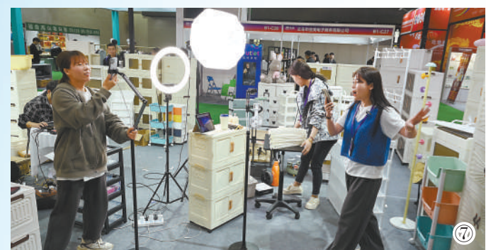
图⑦：义乌电商展会上，参展商正在现场直播日用品。