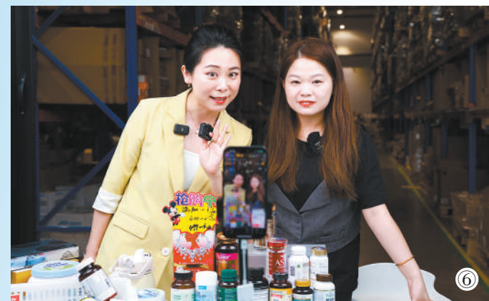
图⑥：义乌综保区入驻企业正在进行“仓播”。