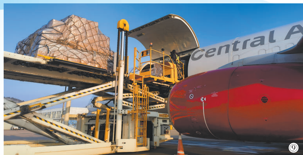
图⑨：一架正在装载货物的货机即将从义乌机场起飞。