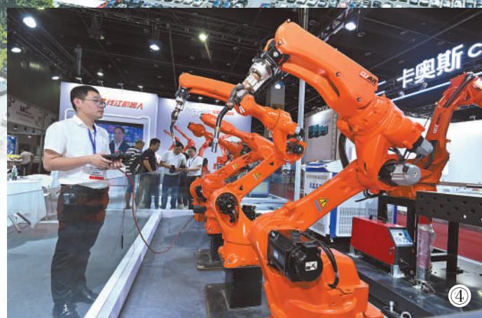
图④：工作人员在义乌展会上展示机器人设备。