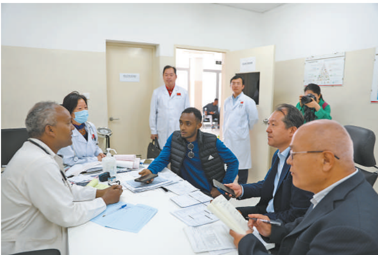
左图：中厄媒体联合采访第七批中国援厄医疗队和奥罗特医院医生。