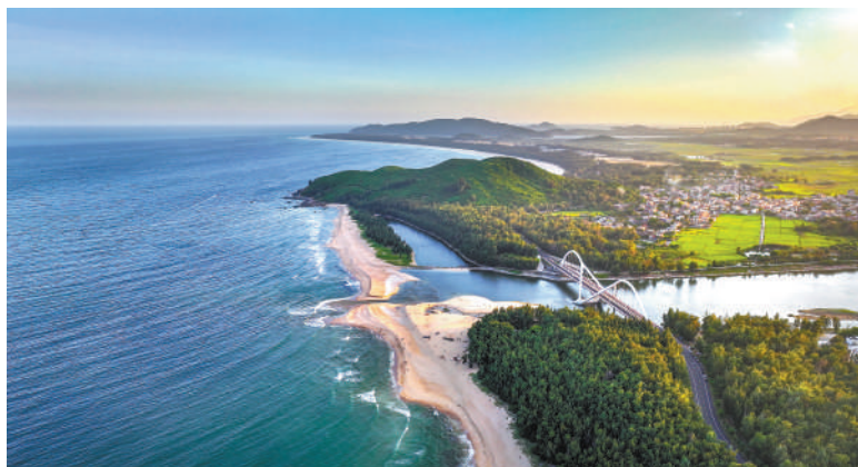
▼自贸港建设以来,海南旅游业蓬勃发展。图为游人在海口的一处海滩嬉戏。