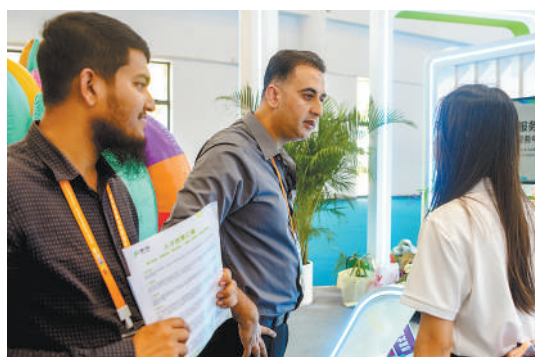
▲在海南举行的消博会上,外国参展客商在了解企业注册信息。