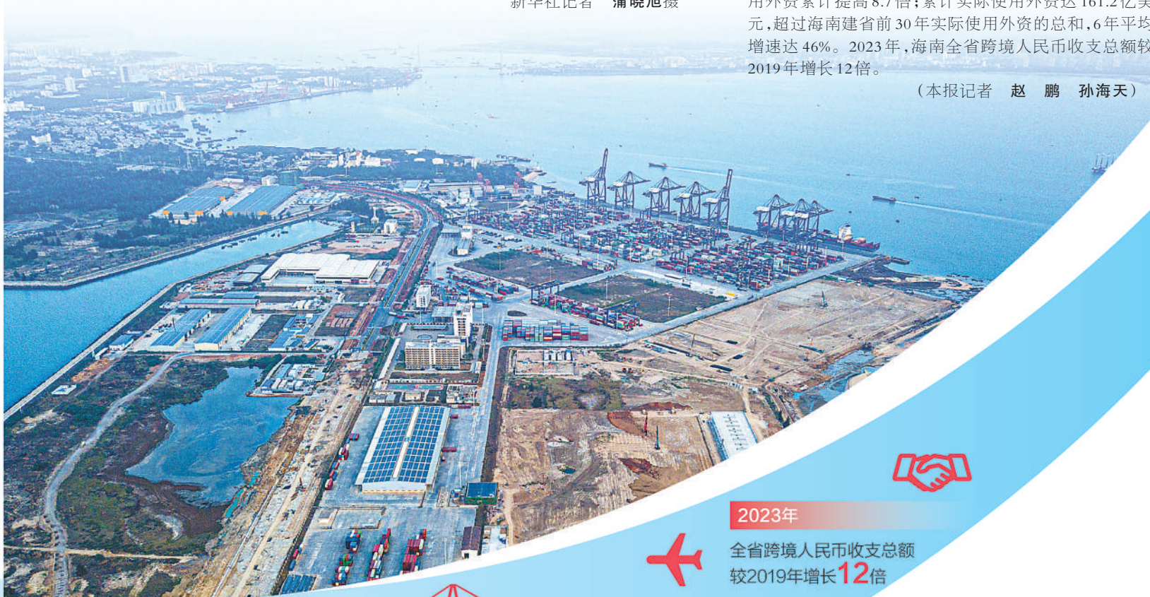
▼洋浦港封关运作项目和洋浦国际集装箱码头。全岛封关运作项目是自贸港建设的标志性和基础性工程,目前,洋浦港封关运作项目配套工程已开工。