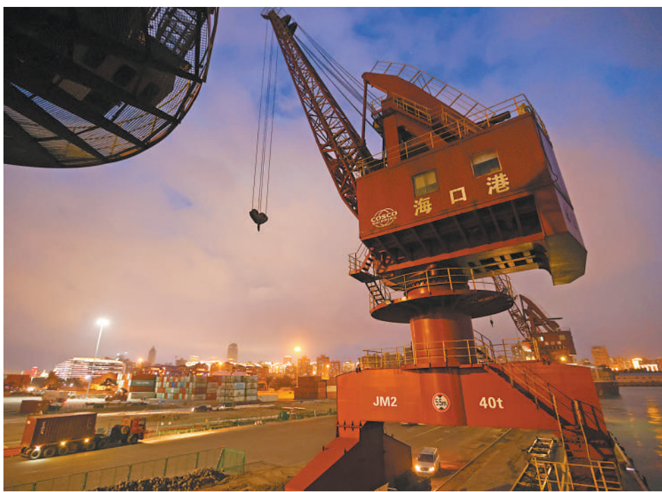
▲自贸港建设以来,海南货物进出口年均增长超20%。图为夜色中繁忙的海口港。