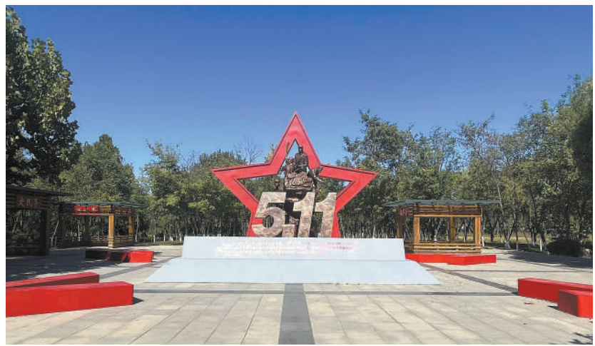
▲山东省肥城市国防双拥主题公园中红星广场一角。主体雕塑生动展现了1939年5月11日，八路军在肥城群众支援下英勇抗击日伪军胜利突围的场景，辅

主题构建是双拥文化空间设计的重点。弘扬双拥精神，为文明城市建设聚气铸魂，是双拥广场作为开放式空间所应发挥的重要作用。不少双拥广场设计没有局限于对某个历史事件的追忆，而是通过对富有地域特色的红色文化和双拥文化的艺术化提炼，以标志性文化景观构建起新的精神场域。在重庆市江津区，双拥广场上的主体雕塑高高矗立、庄严肃穆，以红色的飘带环绕着两支枪的造型，表达“拥军优属、拥政爱民”的寓意。主体雕塑基座上有双拥文化浮雕墙，《双拥赋》诗歌“峥嵘岁月”“模范英雄人物”“拥政爱民”四个板块再现了江津区的红色历史、涌现的英雄模范等。广场上还有一些小型雕塑、宣传栏，与主体雕塑相呼应，展开历史和当下的对话，激发精神力量。这启示我们，开放式红色文化景观营造，要立足该空间所承载的社会意义，以适当的艺术塑造彰显独特的文化内涵。