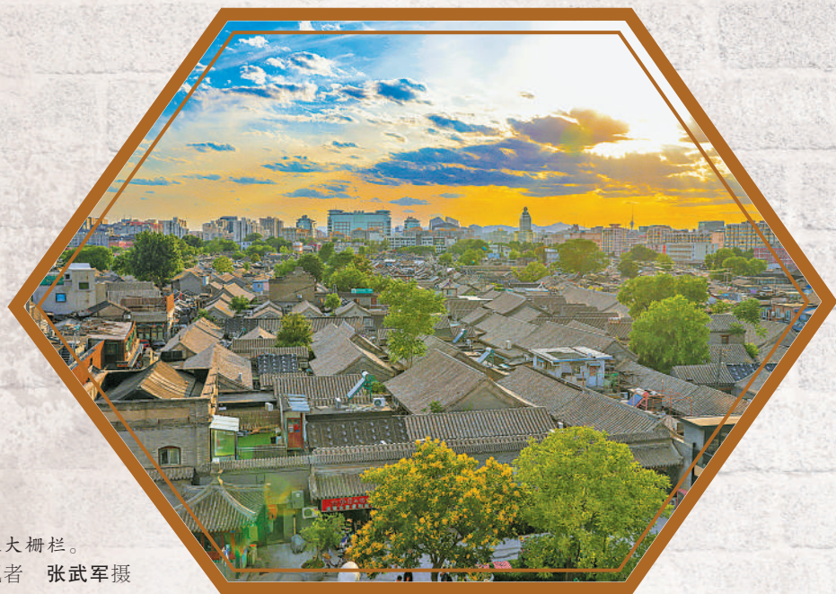
俯瞰大栅栏。