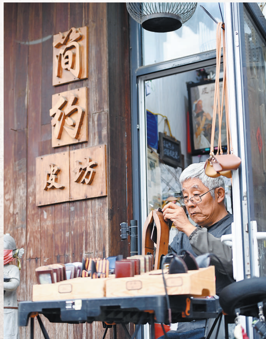
大栅栏杨梅竹斜街上，一名老师傅在制作特色皮具。