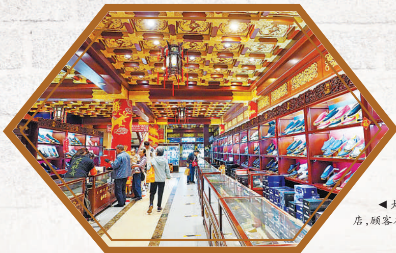
大栅栏内联升总店，顾客在选购商品。