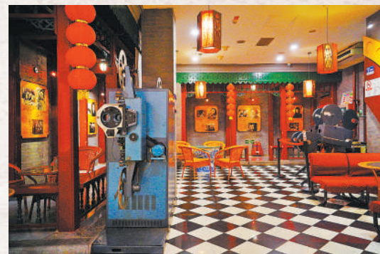
大栅栏内的北京大观楼影院内景。