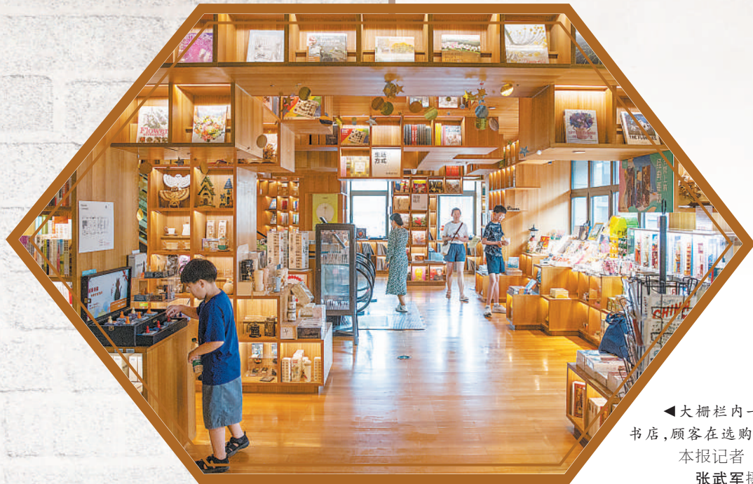
大栅栏内一家书店，顾客在选购。