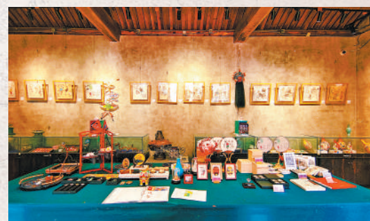
大栅栏铁树斜街上的93号院博物馆内景。