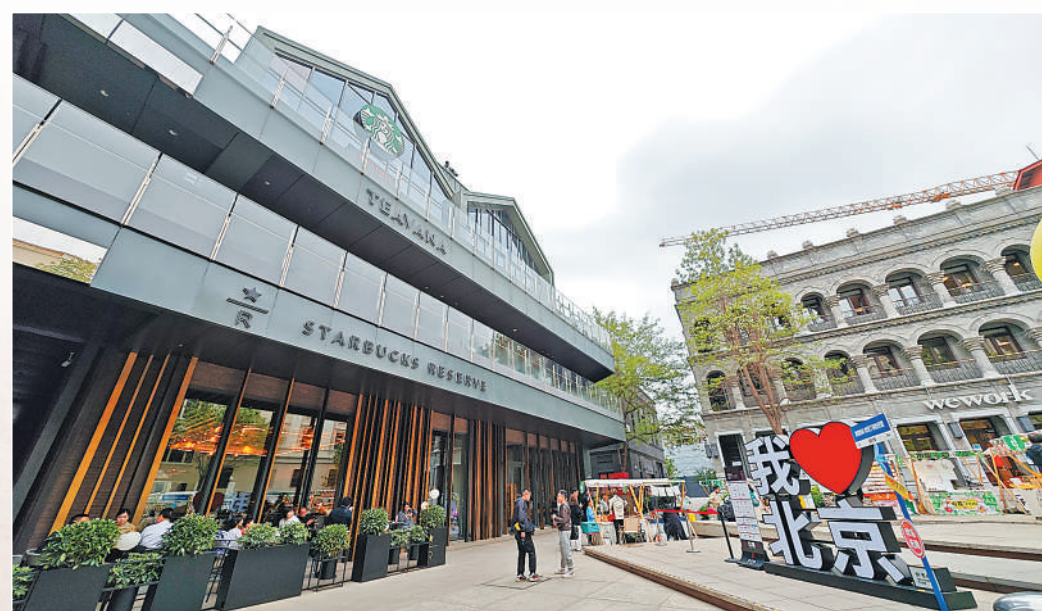
市民游客在大栅栏内的北京坊休闲娱乐。