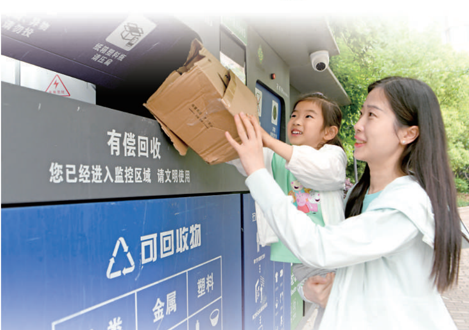
在安徽省淮南市山南新区广弘城小区，居民将废品投入智能垃圾回收柜，可以获得奖励。

建立有效的激励模式，是个人碳账户、碳普惠机制可持续发展的重要因素。有效的激励包括实物奖励、资产累积、碳普惠减排量交易等模式。《报告》指出，目前，广东、天津、上海等省市已推动碳普惠减排量纳入碳市场体系，但更多的碳普惠价值困于其碳普惠平台体系，大多通过购物券、折扣、服务、奖品等商业激励和政策激励模式实现价值兑换，兑现途径有限，难以实现全部碳普惠价值的流转与闭环。