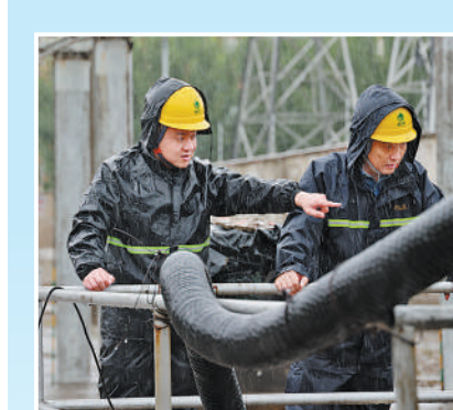
上图：7月17日，安徽省宿州市砀山县砀山变电站工作人员检查防汛排涝设备。

18日中午，洪峰已从唐河县城区过境，水位逐渐下降。但在河堤上，依然有很多党员干部正在巡护的身影。