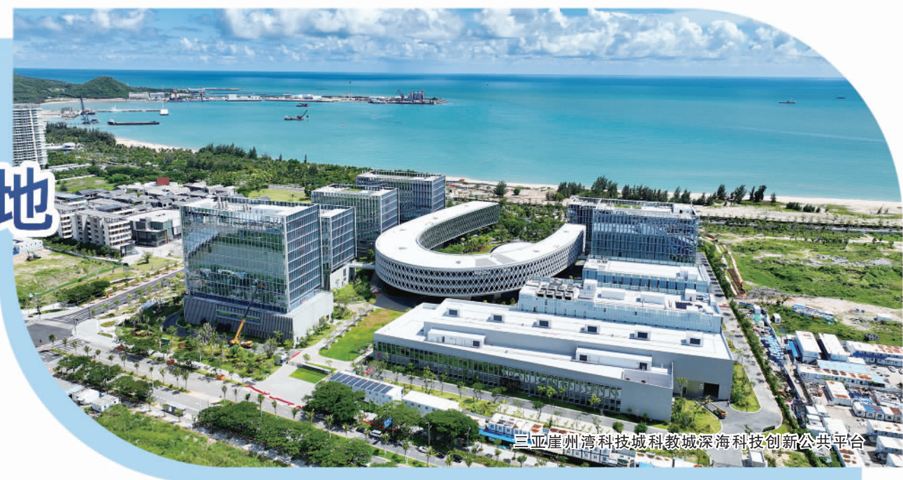
三亚崖州湾科技城科教城深海科技创新公共平台

近年来,三亚围绕深远海装备研发制造、深海新材料开发、深海新能源研发、深海采矿等产业方向,锚定打造国际深海科技创新中心的战略定位,集聚优势资源,努力在深海进入、深海探测、深海开发方面掌握关