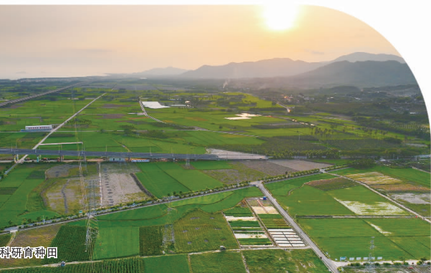
三亚南繁科研育种园