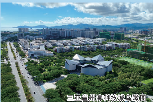
三亚崖州湾科技城鸟瞰图