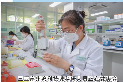
三亚崖州湾科技城科研人员正在做实验