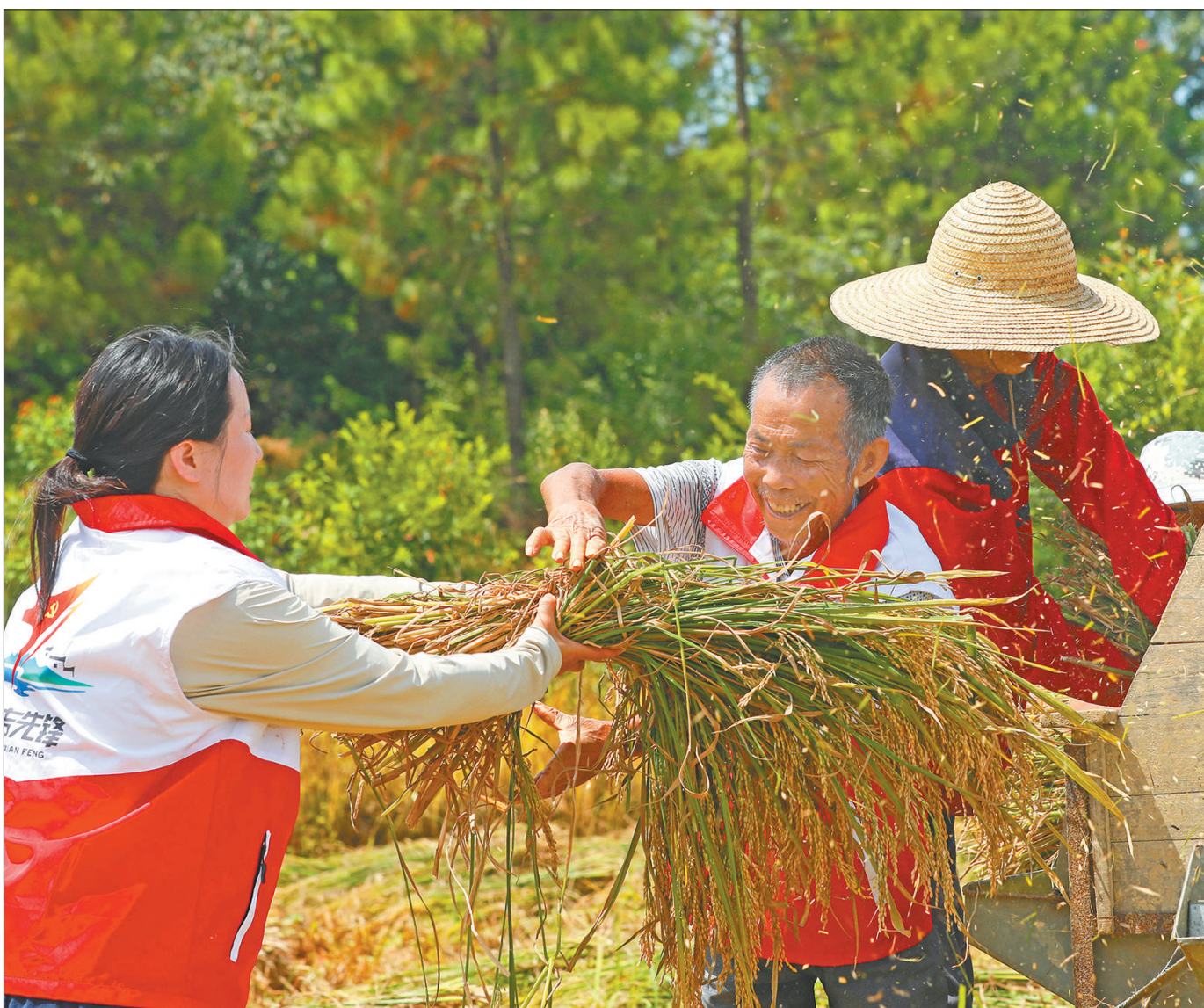
连日来,江西省泰和县发挥党员志愿服务团队作用,组织乡村党员开展助农服务活动,帮助农民抢收夏粮。图为7月13日,泰和县塘洲镇土洲村,党员志愿者帮助群众收水稻。

近3年来,该县政协委员工作室共反映社情民意信息200余条,开展直播助农、助企纾困、医疗惠民等各类为民服务活动100余场。淳安县政协负责人表示:“下一步,我们将完善工作机制,发挥政协委员专业优势,强化责任担当、推动履职尽责,鼓励政协委员深入一线调研,通过力量整合、服务下沉,助力办好民生实事。”