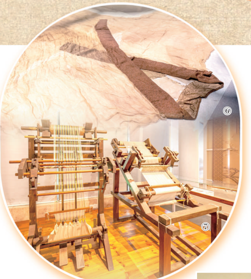
图⑥:马王堆汉墓出土的素纱襌衣。 图⑦:中国丝绸博物馆馆藏织机。 图⑧:中国丝绸博物馆展出现代复原的“五星出东方利中国”汉代织锦护臂。 图⑨:中国丝绸博物馆馆藏丝织锦残片。