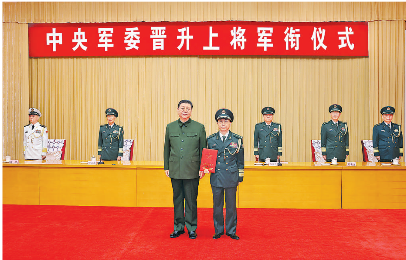
7月9日,中央军委晋升上将军衔仪式在北京八一大楼举行。中央军委主席习近平向晋升上将军衔的中央军委政治工作部常务副主任何宏军颁发命令状。