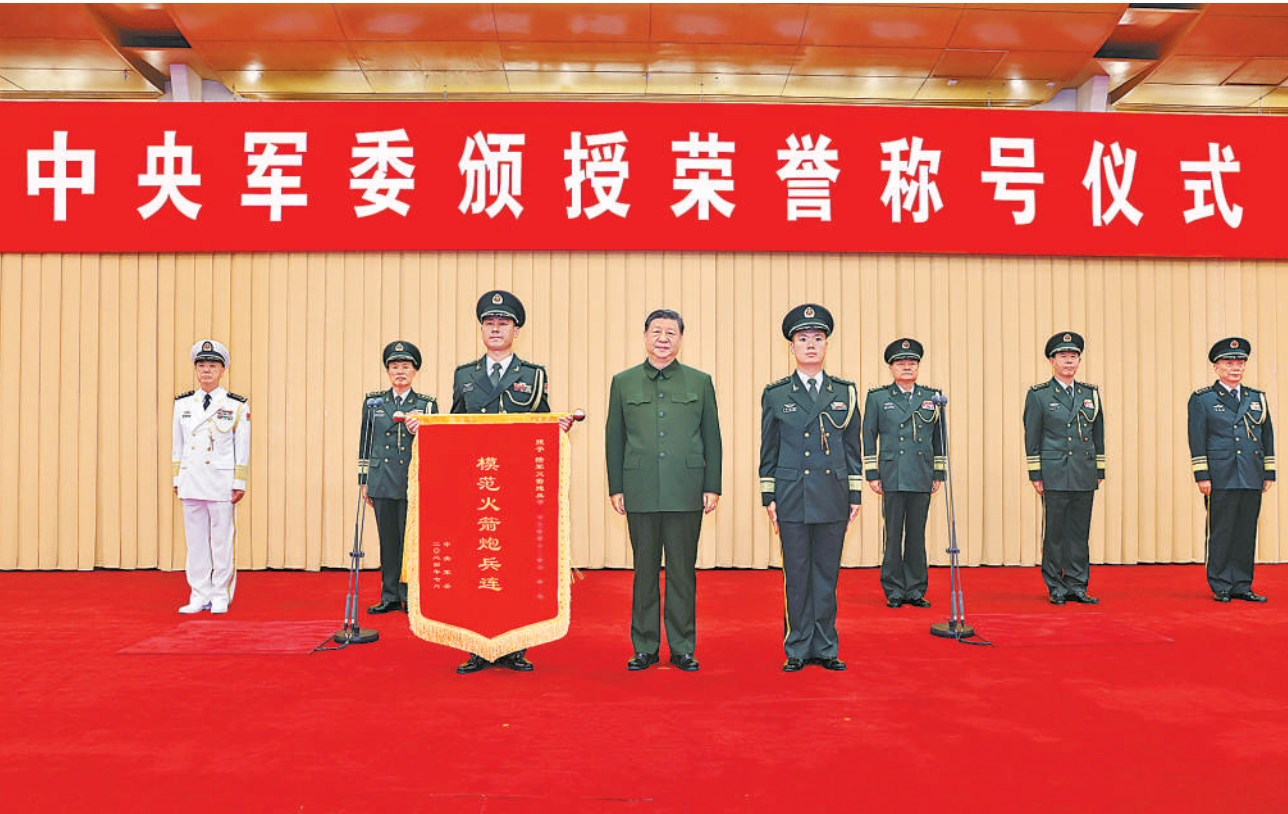
7月9日,中央军委在京隆重举行荣誉称号颁授仪式。中共中央总书记、国家主席、中央军委主席习近平向获得“模范火箭炮兵连”荣誉称号的陆军某旅一营二连颁授奖旗,并同该连官兵代表合影留念。

新华社北京7月9日电 (记者梅常伟)在中国人民解放军建军97周年之际,中央军委9日在京隆重举行荣誉称号颁授仪式。中共中央总书记、国家主席、中央军委主席习近平向获得荣誉称号的单位颁授奖旗。 八一大会仪式现场,部队官兵和文职人员代表整齐列队,气氛庄重热烈。下午3时30分许,18名礼兵正步入场,持枪伫立两侧,颁授仪式开始,全场高唱中华人民共和国国歌。中共中央政治局委员、中央军委副主席张又侠宣读习近平签署的中央军委授予荣誉称号命令,中共中央政治局委员、中央军委副主席何卫东主持仪式。 在铿锵有力的《人民军队忠于党》乐曲中,习近平向获得“模范火箭炮兵连”荣誉称号的陆军某旅一营二连颁授奖旗。