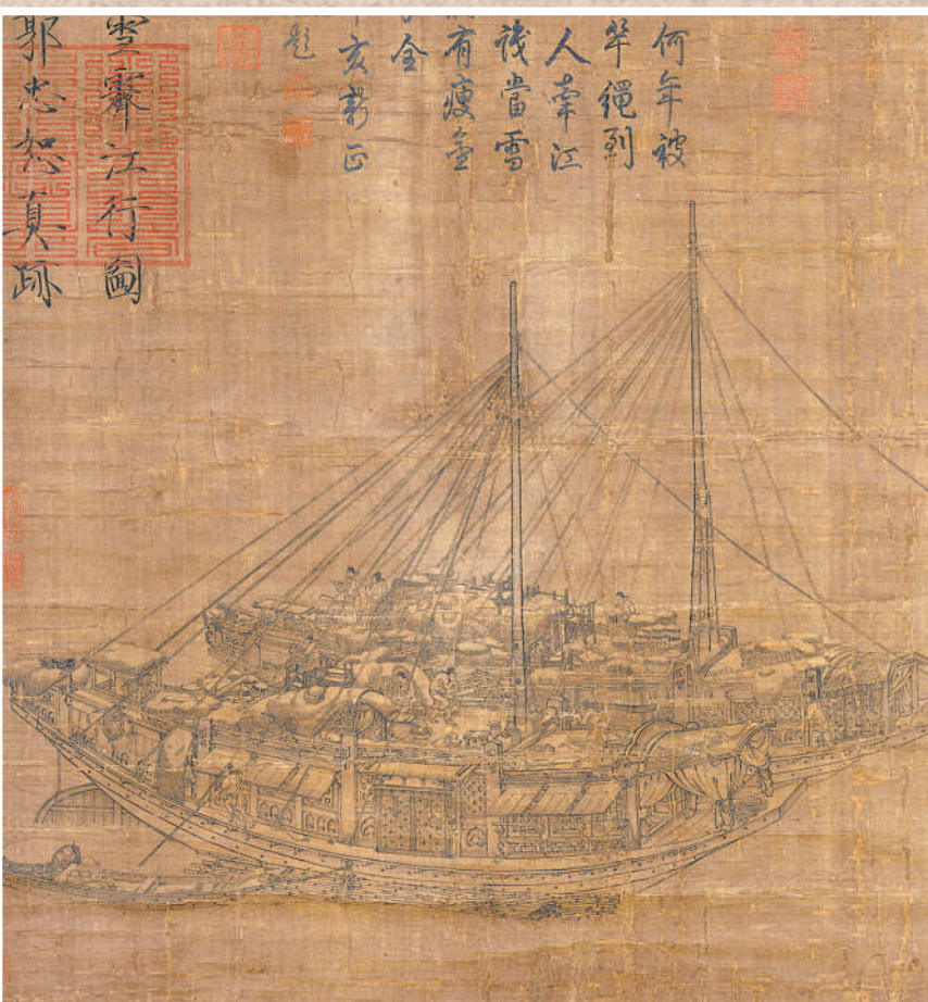
▲中国画《雪霁江行图》(局部)，作者为北宋郭忠恕。