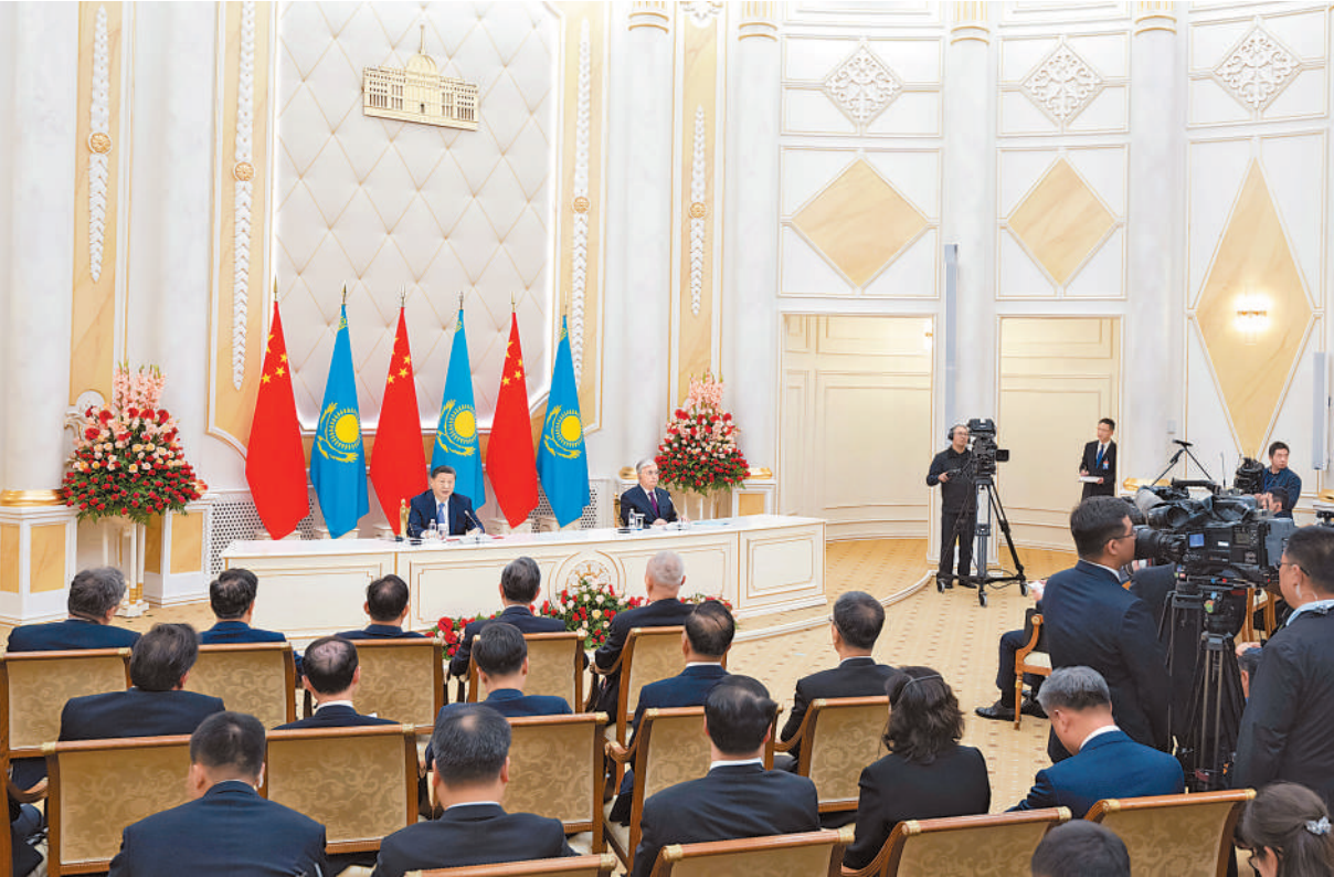
当地时间7月3日中午,国家主席习近平在阿斯塔纳总统府同哈萨克斯坦总统托卡耶夫会谈后共同会见记者。