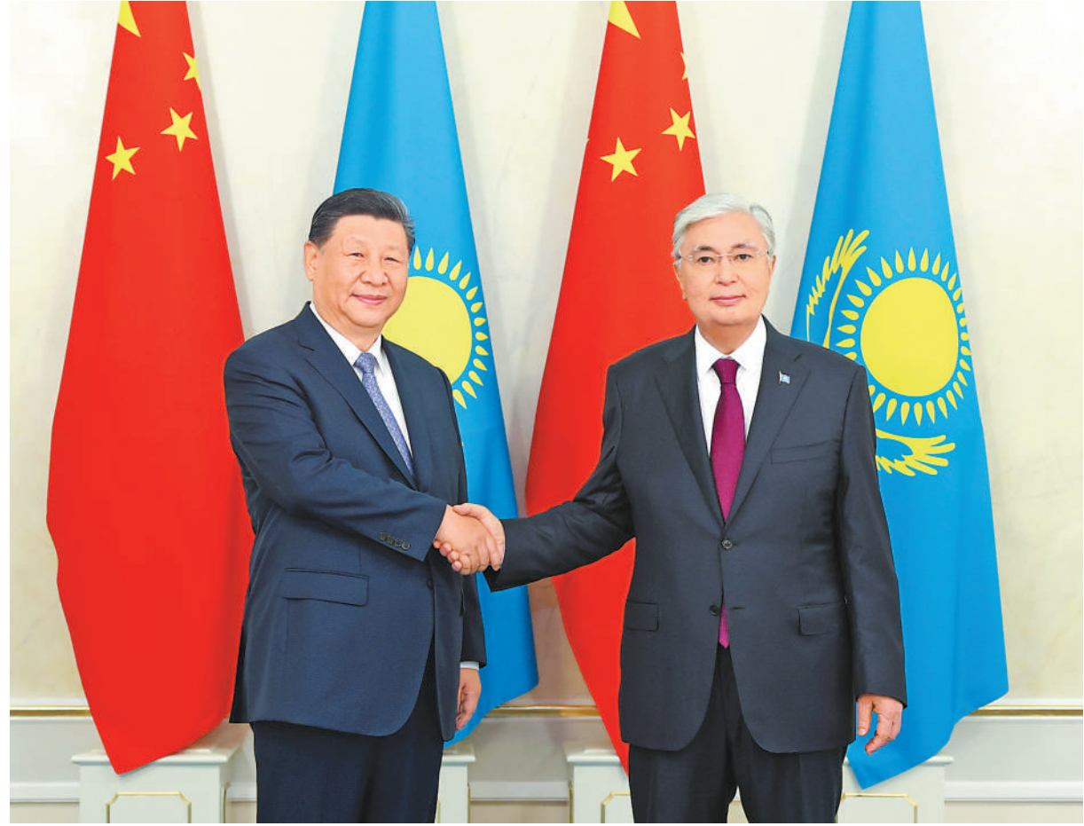
当地时间7月3日上午,国家主席习近平在阿斯塔纳总统府同哈萨克斯坦总统托卡耶夫举行会谈。这是习近平同托卡耶夫握手。