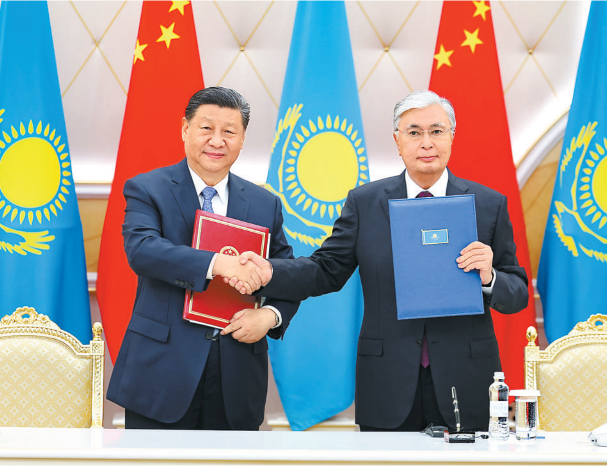
当地时间7月3日上午,国家主席习近平在阿斯塔纳总统府同哈萨克斯坦总统托卡耶夫举行会谈。会谈后,两国元首共同签署《中华人民共和国和哈萨克斯坦共和国联合声明》,并共同见证交换经贸、互联互通、航空航天、教育、媒体等领域数十项双边合作文件。

本报阿斯塔纳7月3日电 (记者杜尚泽、王芳)当地时间7月3日上午,国家主席习近平在阿斯塔纳总统府同哈萨克斯坦总统托卡耶夫举行会谈。 习近平乘车抵达总统府时,托卡耶夫总统热情迎接。六架哈萨克斯坦空军战机从总统府上空飞过,拉出象征中国国旗的红黄色彩烟,以最高礼仪欢迎习近平对哈萨克斯坦进行国事访问。 托卡耶夫为习近平举行隆重欢迎仪式。总统府大厅气势恢宏,礼兵威武挺拔。两国元首分别同对方陪同人员一一握手致意。两国元首登上检阅台,军乐团奏中哈两国国歌。习近平在托卡耶夫陪同下检阅仪仗队。 欢迎仪式后,两国元首举行小范围会谈。习近平指出,去年,我和托卡耶夫总统在西安和北京两次会晤,就中哈关系发展作出新部署新规划,引领中哈关系“黄金30年”快速发展。中方始终从战略高度和长远角度看待中哈关系,将哈萨克斯坦视为中国周边外交的优先方向和在中亚的重要合作伙伴,中方愿维护好、发展好中哈关系的意愿和决心坚定不移,不会因一时一事或国际风云变幻而改变。中国永远是哈方可以倚重和信赖的好邻居好伙伴。中方愿同哈方继续加强天然气等传统能源合作,拓展光伏、风电等新能源合作,支持更多中国企业赴哈萨克斯坦投资,助力哈方将资源优势转换为发展能力,实现绿色、低碳、可持续发展。 托卡耶夫表示,习近平主席对哈萨克斯坦进行国事访问对哈中关系发展具有历史性重大意义。中国是哈萨克斯坦的友好邻邦、亲密朋友和重要战略伙伴,哈中关系基于牢固的睦邻友好和坚定的相互支持,呈现出前所未有的良好发展势头,贸易、能源、农业、矿产等领域合作取得重要成果,造福了两国人民,堪称中国与国关系的典范。哈方祝贺中国取得的全方位历史性成就,相信在习近平主席英明领导下,中国在新时代中国特色社会主义道路上必将取得新的更大成就。哈方愿同中方一道,进一步挖掘两国在能源、矿产、新能源、互联互通等