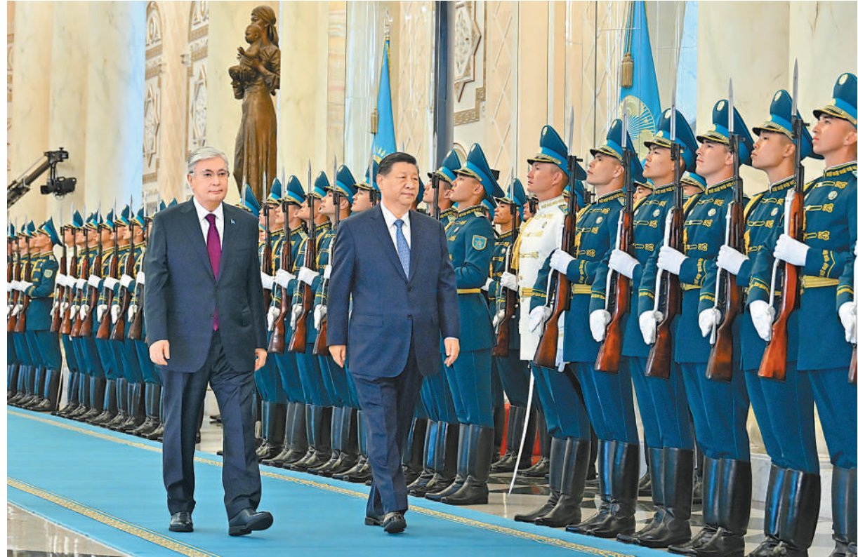
当地时间7月3日上午,国家主席习近平在阿斯塔纳总统府同哈萨克斯坦总统托卡耶夫举行会谈。托卡耶夫为习近平举行隆重欢迎仪式。这是习近平在托卡耶夫陪同下检阅仪仗队。