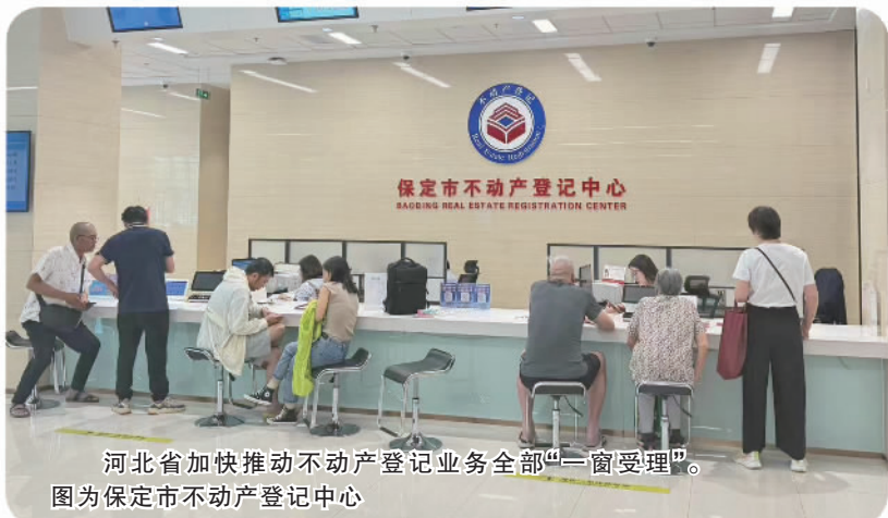
河北省加快推动不动产登记业务全部“一窗受理”。图为保定市不动产登记中心

近年来，河北省自然资源厅全面优化自然资源领域营商环境，不断提升自然资源服务质量和效率。围绕要素保障、简化审批、管理服务和改革创新四方面，制定了一系列务实举措，形成了全系统“一盘棋”局面，充分发挥自然资源要素保障作用，服务经济社会高质量发展。