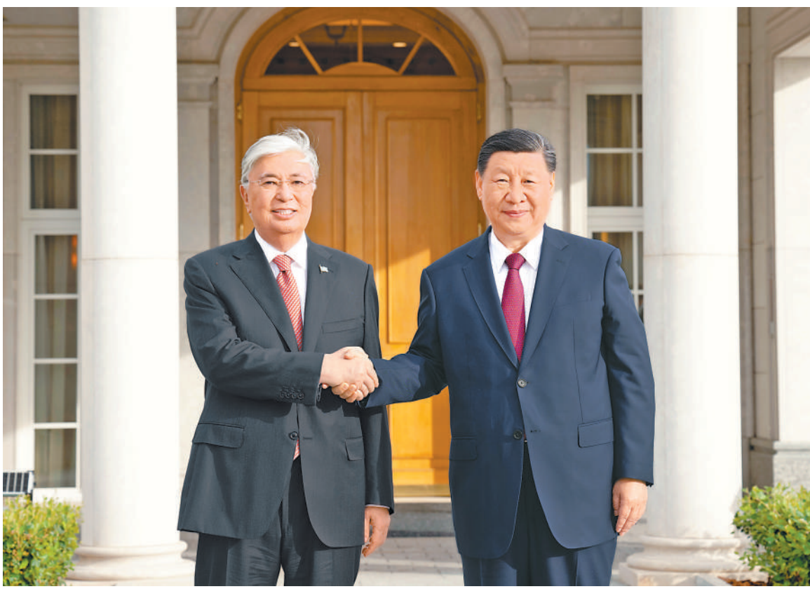
当地时间七月二日晚，国家主席习近平应邀同哈萨克斯坦总统托卡耶夫共进晚餐，在愉快温馨的环境中就中哈关系和共同关心的问题进行了亲切友好的交流。这是习近平同托卡耶夫握手。

本报阿斯塔纳7月2日电 当地时间7月2日晚，国家主席习近平应邀同哈萨克斯坦总统托卡耶夫共进晚餐，在愉快温馨的环境中就中哈关系和共同关心的问题进行了亲切友好的交流。