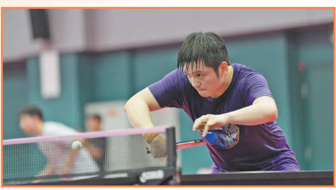
▲乒乓球队队员樊振东在训练中。