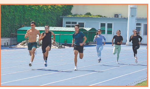
▲中国接力队队员在训练中。

作为今年最盛大的体育赛事,2024年巴黎奥运会将于当地时间7月26日至8月11日举行。奥运会是运动员竞技交流的平台,也是展现风采的舞台。步入备赛的冲刺阶段,中国运动员争分夺秒、全力以赴。 拼搏是竞技场上最动人的旋律。在备赛奥运的日子里,中国运动员用汗水浇灌成长,有的展开集训进一步打磨细节,有的通过热身赛查找不足、调整状态,有的赶赴欧洲尽早适应参赛环境……勇于拼搏、追逐梦想为他们打下相同的印记。 东京奥运会,中国体育代表团夺得38枚金牌、32枚银牌、19枚铜牌,充分展现了中国体育的实力和中国运动员的风采。期待在巴黎奥运会的赛场上,中国运动员延续精彩、再创佳绩! (本报记者 刘硕阳)