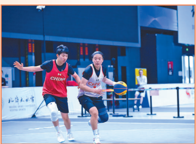
▲三人篮球队队员在训练中。