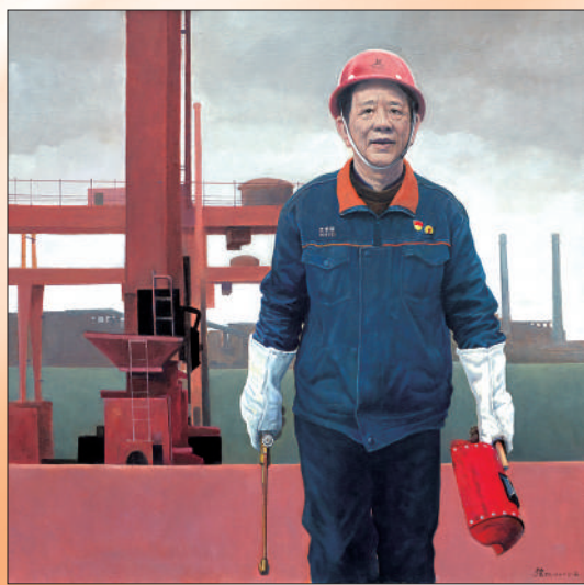
▲油画《大国工匠》，作者张弦。

在讲述共产党员故事的美术佳作中，油画作品占据相当比例。这些作品既以油画的较强表现力使人物形象生动饱满，也体现了美术工作者对油画民族化的持续探索。比如，在中国文学艺术界联合会、中国美术家协会、中国国家博物馆共同主办的“最美中国人”美术作品展上，孙立新《高原“守护神”——