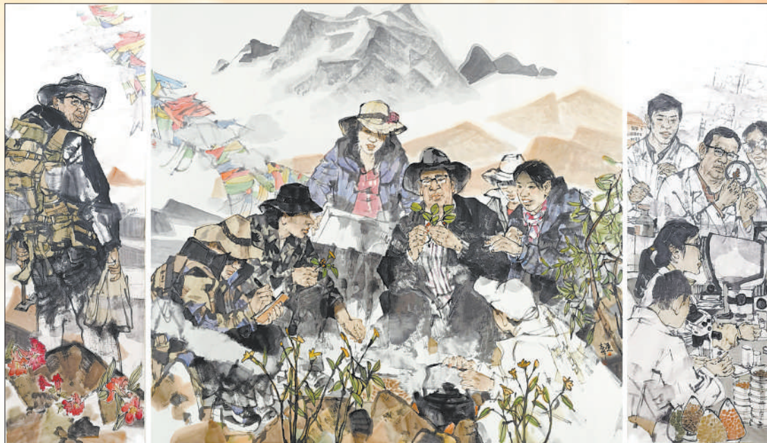
▲中国画《时代楷模——优秀共产党员钟扬教授》，作者张渭人。