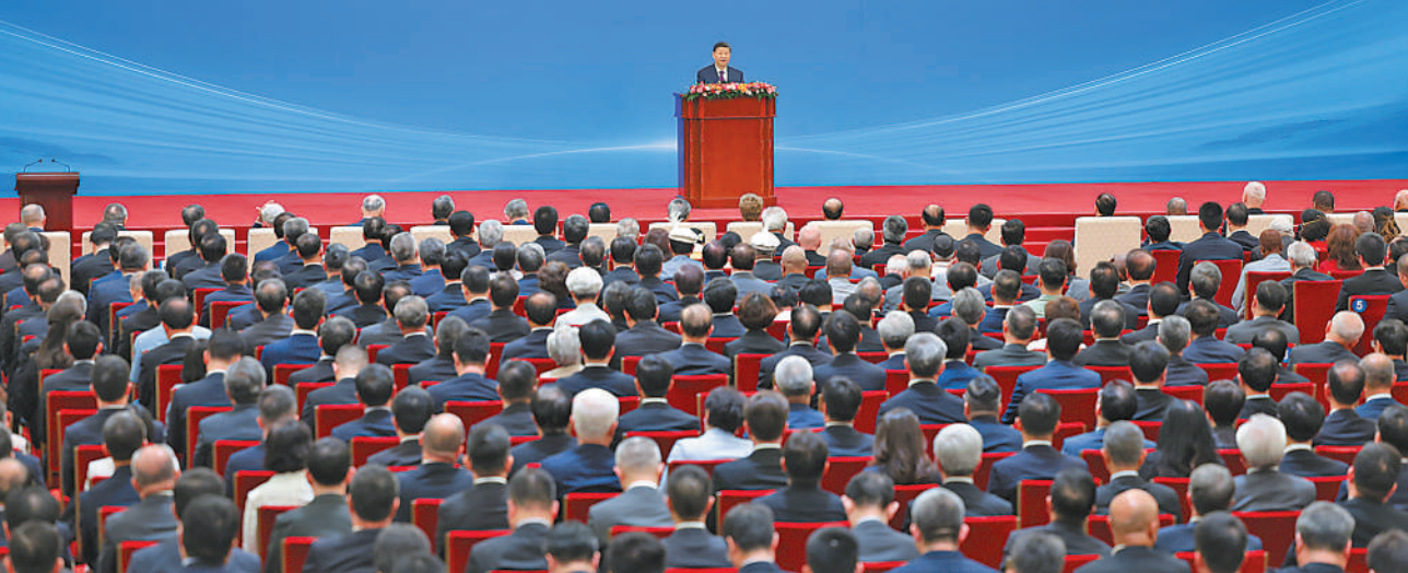
6月28日上午，和平共处五项原则发表70周年纪念大会在北京人民大会堂隆重举行。国家主席习近平出席纪念大会并发表题为《弘扬和平共处五项原则，携手构建人类命运共同体》的重要讲话。

Conference Marking the 70 th Anniversary of the Five Principles of Peaceful Coexistence 2024年6月28日 中国·北京 June 28, 2024 Beijing, China