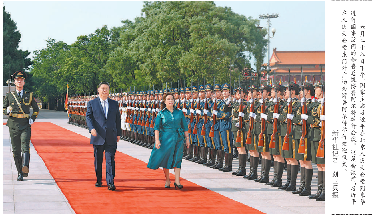
六月二十八日下午，国家主席习近平在北京人民大会堂同来华进行国事访问的秘鲁总统博鲁阿尔特举行会谈。这是会谈前，习近平在人民大会堂东门外广场为博鲁阿尔特举行欢迎仪式。

新华社北京6月28日电 (记者孙奕)6月28日下午，国家主席习近平在北京人民大会堂同来华进行国事访问的秘鲁总统博鲁阿尔特举行会谈。 习近平指出，中国和秘鲁都是文明古国，两国友谊源远流长，人民友好深入人心。秘鲁是最早同新中国建交、最早同中国建立全面战略伙伴关系的拉美国家之一，也是最早同中国签署一揽子自由贸易协定的拉美国家。近年来，在双方共同努力下，中秘各领域合作取得丰硕成果，中国企业在秘重大合作项目为秘鲁经济发展、民生改善发挥了重要作用。中方高度重视发展中秘关系，愿同秘方夯实政治互信，深化务实合作，促进文明互鉴，加强多边协作，推动中秘全面战略伙伴关系不断迈上新台阶。 习近平强调，坚持相互尊重、平等相待，是中国一以贯之的处世之道，也是中秘全面战略伙伴关系始终保持高水平发展的根本原因。中方支持秘鲁走符合本国国情的发展道路，愿同秘方坚定相互支持，坚定不移推进中秘友好合作。(下转第三版)