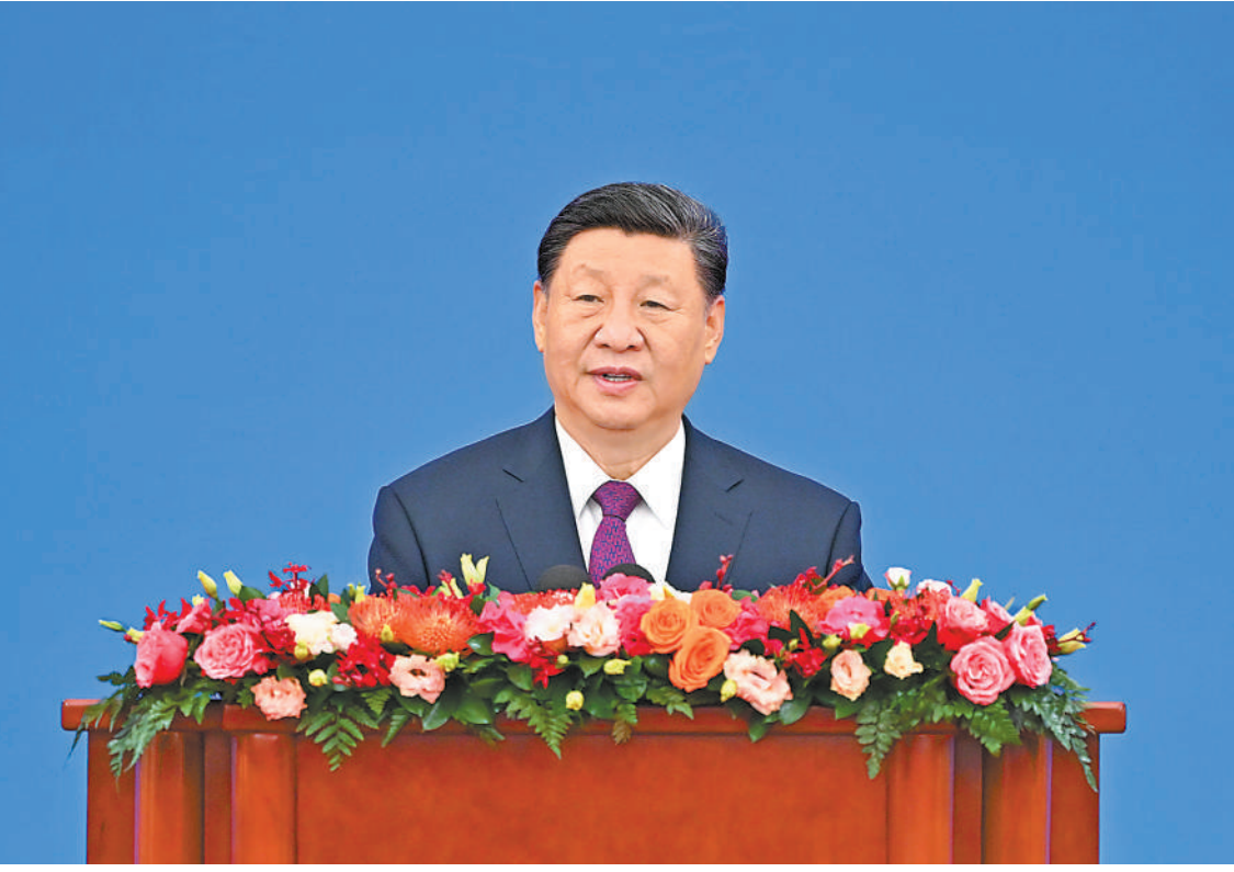
六月二十八日上午，和平共处五项原则发表七十周年纪念大会在北京人民大会堂隆重举行。国家主席习近平出席纪念大会并发表题为《弘扬和平共处五项原则，携手构建人类命运共同体》的重要讲话。